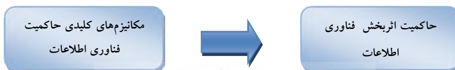
شکل 3 چارچوب نظری پژوهش

چارچوب نظری این پژوهش درصدد شناسایی مکانیزم‌های کلیدی، بررسی وضعیت مکانیزم‌ها و همچنین بررسی ارتباط بین مکانیزم‌های شناسایی شده و اثربخشی حاکمیت فناوری اطلاعات در صنعت بانکداری ایران می‌باشد. در فاز شناسایی، متغیرهای عملیاتی - که مکانیزم‌های کلیدی و مؤثر بر حاکمیت فناوری اطلاعات می‌باشند - مطرح است و در فاز بررسی، متغیرهای مستقل، «مکانیزم‌های شناسایی شده» و متغیر وابسته «حاکمیت اثربخش فناوری اطلاعات» می‌باشند. در این راستا چارچوب نظری پژوهش در شکل 3 ارائه شده است.