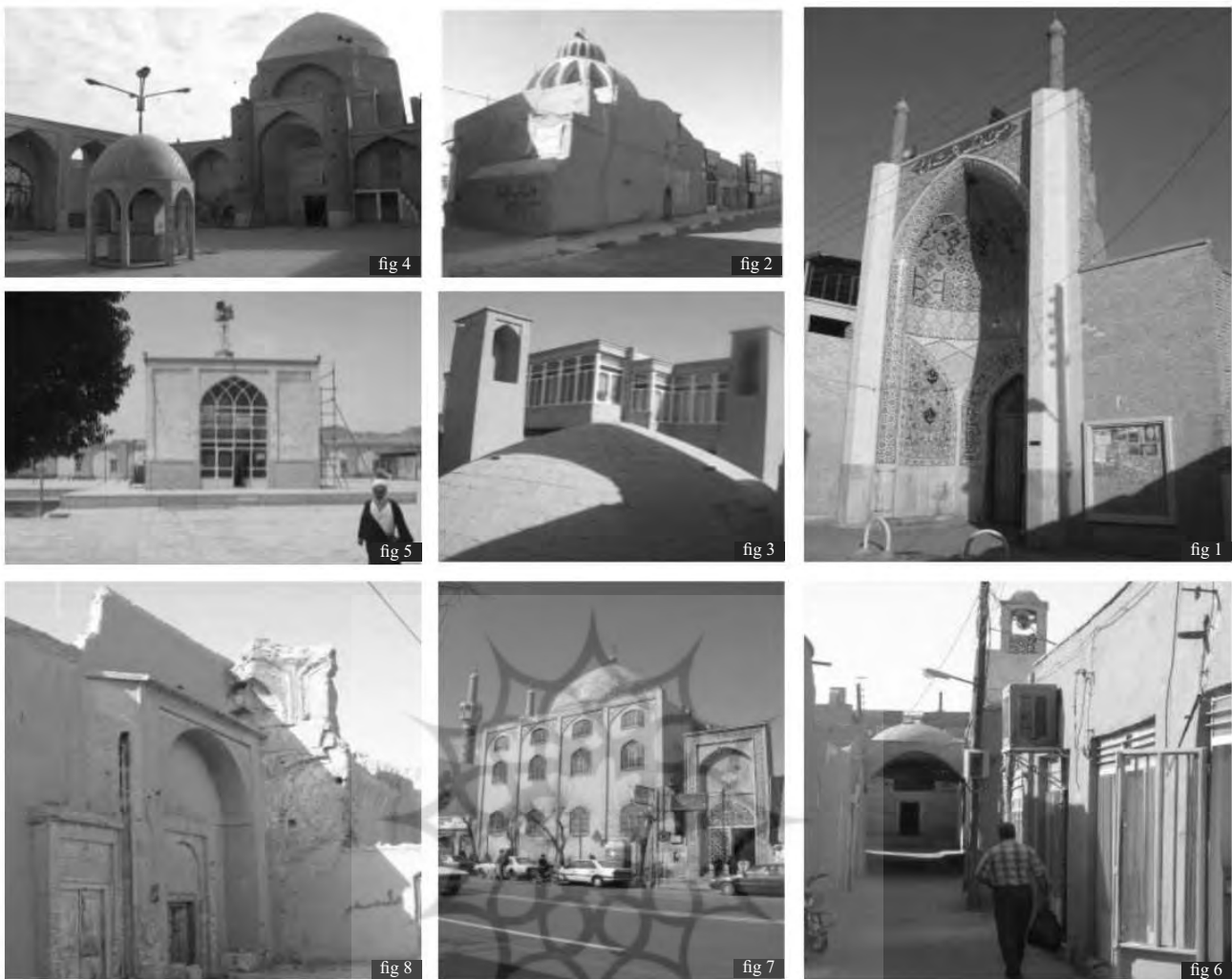
تصویر ۲. تعدادی از عناصر شاخص محله‌ها. (۱) مسجد بزرگ پشت باغ؛ (۲) بقعه سید خلیل و سید جلیل؛ (۳) آب‌انبار نقشین؛ (۴) مسجد و بقعه سهیل بن علی؛ (۵) مصلی صفدر خانی و چهارطاقی آن؛ (۶) گذر دارالشفاء و مسجد فرط؛ (۷) آستانه مقدس شاهزاده فاضل (ع)؛ (۸) و (۹) مجموعه تاریخی ابودردا. Fig. 2. A number of prominent features in neighbourhoods: 1) Great mosque of Posht-e Bāgh; 2) Seyyed Khalil & Seyyed Jalil mausoleum; 3) Naghshin ĀB-ANBĀR; 4) Mosque & mausoleum of Sahl-ebne-Ali; 5) chahar-taaqi (arsade) of Safdar-Khāni MOSALLĀ; 6) Passage of Dār-osh-Shafā and Fort Mosque; 7) Shāh-Zādeh Fāzel Holy shrine; 8) Abo-Dardā historical complex.

«شخصیت و هویت»، «سرمایه اجتماعی» و «خاطرات جمعی» به‌عنوان مؤلفه‌های ارزش فرهنگی؛ و «ارزش کالبدی»، «ارزش عملکردی»، «ارزش اقتصادی»، «ارزش اجتماعی» و «ارزش آموزشی» به‌عنوان مؤلفه‌های ارزش‌های روز محله. براساس کدهای ارایه شده در متن‌ها، مشاهده می‌شود مؤلفه‌هایی که ارزش تاریخی و فرهنگی را از نظر مردم برای محله تأمین می‌کنند در کلیات با مؤلفه‌های ناشی از رویکرد حفاظت و بازآفرینی یکپارچه در اسناد و نظرهای جهانی و در نتیجه نظر متخصصان، همخوانی داشته و تنها در مواردی، بیان آن متفاوت است. تنها مورد تفاوت قابل ذکر، قایل شدن سرمایه اجتماعی به‌عنوان ارزش فرهنگی از طرف مردم است که در پیشینه موضوع تنها در بخش