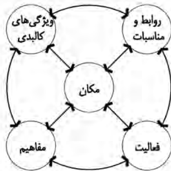
تصویر ۲. برداشتی کلی از تعاریف ارائه شده مکان به وسیله دیوید کانتر، جان پانتر و توماس نیت. مأخذ: نگارندگان.