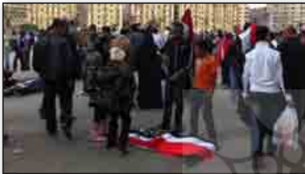
تصویر ۱۷. پرچم فروشان. Fig. 17. Flag sellers.