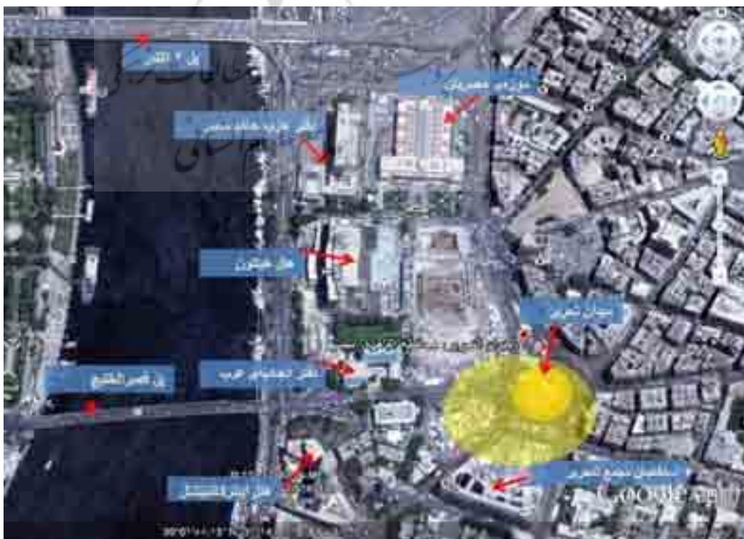
نقشه ۳. میدان التحریر و عناصر مهم پیرامون آن.