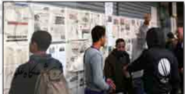
تصویر ۱۰. دیوار روزنامه ها. Fig. 10. Newspapers wall.