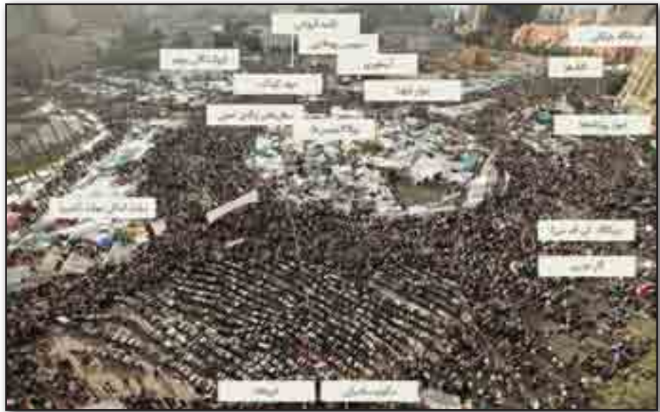
Fig. 5. Tahrir Square in times of revolution: all of the elements and buildings have new functions.

از علایق و سلايق سیاسی و مذهبی را در کنار هم گرد هم آورده بود. حضور زنان با عقاید و پوشش‌های گوناگون خود شاهدهی بر این همگرایی و حس عمیق اجتماعی است که تنها به واسطهٔ مشارکت فضا و مردم امکان‌پذیر می‌شود. آنچه جالب‌توجه است، توجه مبارزان به تغییر تاریخ به عنوان نتیجهٔ مبارزهٔ پرشور خود است. چنانکه یکی از مبارزان به صراحت اشاره می‌کند که فردا دیگر همچون دیروز نخواهد بود و این خود نشان از آگاهی مبارزان از نقششان در تغییر تاریخ دارد (Salama, 2013).