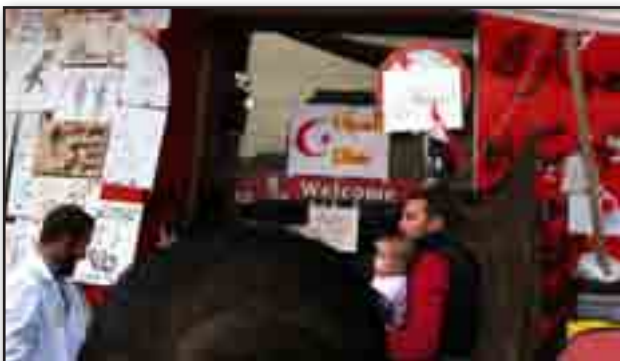
تصویر ۱۳. کلینیک برپا شده در ساختمان تسخیر شده رستوران کی اف سی. مأخذ : http://www.bbc.co.uk/news/world-12434787 Fig. 13. A small hospital raised in former KFC restaurant building. Source: http://www.bbc.co.uk/news/world-12434787 .