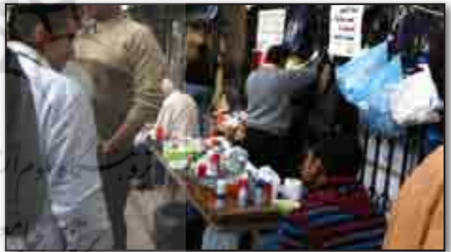
تصویر ۱۸. داروخانه. Fig. 18. Pharmacy.