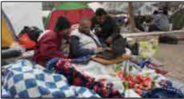
تصویر ۷. وبلاگ نویس ها. Fig. 7. The bloggers.