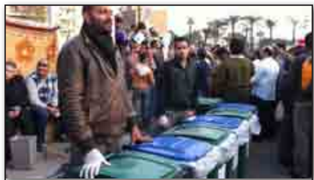
تصویر ۱۲. جمع آوری زباله. Fig. 12. Garbage & dumping system.