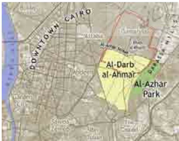
نقشه ۱. محدوده پروژه و نواحی مجاور.

فرمانداری قاهره در سال ۱۹۹۸ تصمیم به بازسازی و نوسازی مناطق محروم شهر گرفت. در این راستا، در سطح تصمیم‌گیری کلان محله منشیت‌ناصر را به عنوان پرمسأله‌ترین قسمت شهر به ناحیه‌های مختلف تقسیم کرده و در هر ناحیه طرحی ویژه را به اجرا درآورد. پس از انجام مطالعات کل مجموعه در سال‌های ۱۹۹۸ تا ۲۰۰۱، فاز اجرایی آن در سال ۲۰۰۱ شروع و در سال ۲۰۰۴ به پایان رسید. مساحت کل طرح در حدود ۳۸۰ هکتار برآورد شده و هزینه اجرای آن مشخص نیست. رویکرد اصلی مطرح‌شده در این طرح، رویکرد مشارکتی است. لازم به ذکر است که این طرح در سال ۲۰۰۷ موفق به کسب جایزه آقاخان شده است (AghaKhan Award Cycle, 2007). راهبردهای این پروژه ناظر بر بهبود شرایط معیشتی و امنیتی مردم، استفاده از نیروی مردمی در تغییرات کالبدی (تصویر ۲)، بهبود زیرساخت‌ها و نیز مرمت و حفظ آثار تاریخی موجود در محل است (Bianca, 2005).