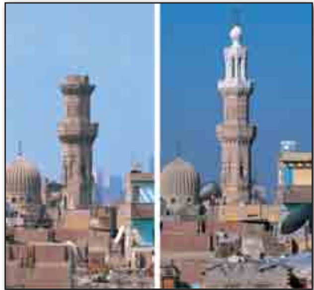
تصویر ۴. مسجد ام‌السلطان، قبل و بعد از مرمت. Fig. 4. Omm-e-sultan mosque, before and after the restoration.

• شکل‌گیری شبکه فضا-مردم : مشارکت فضا و مردم الگوی تجمع مردم در میدان، مشارکت مردم و فضا را به‌خوبی به نمایش می‌گذارد. مبارزان در همان روزهای نخست با خارج