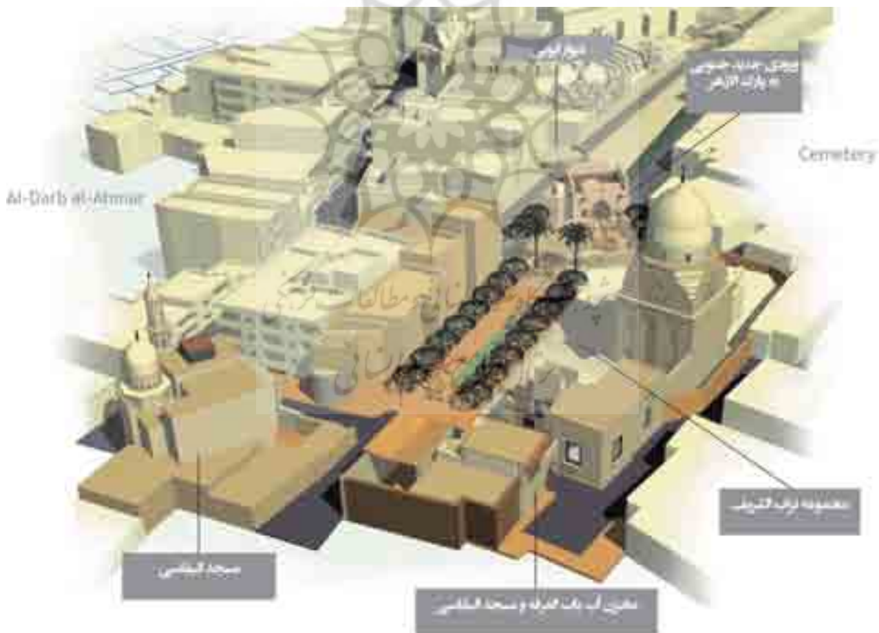
تصویر ۳. دروازه جدید جنوبی و مجموعه تراب‌الشریف. Fig. 3. The new southern gate and Torab-al-sharif complex.