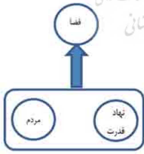
نمودار ۱. نهاد قدرت + مردم: تغییر فضا.

این پروژه در ناحیه باب‌الوزیر در جنوب محله درب‌الاحمر (نقشه ۱) و در جوار محله منشیت‌ناصر، از محله‌های فقیرنشین شهر قاهره (پایتخت کشور مصر) واقع شده است. درب‌الاحمر در جنوب مسجدهای معتبر الازهر و خان‌الخلیل و بازار توریستی مرکزی قاهره