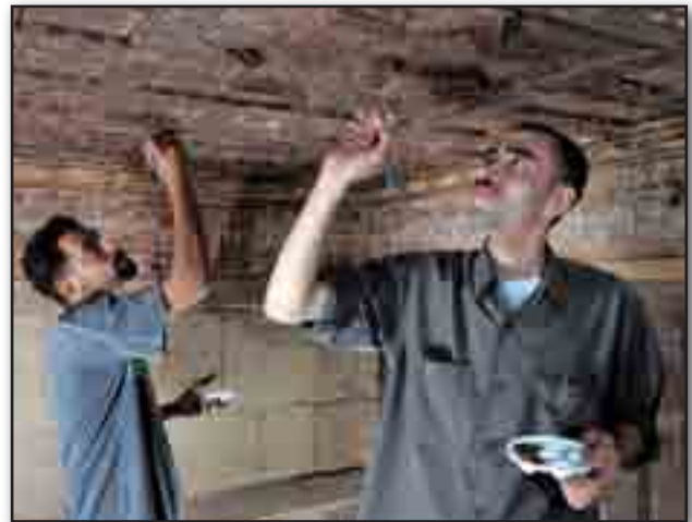
تصویر ۲. استفاده از نیروهای بومی در مرمت ابنیه. Fig. 2. Using native labor in restoration of historic buildings.

سابقه میدان تحریر به میانه قرن ۱۹ بازمی‌گردد. طی ۱۶ سال از سال ۱۸۶۳ تا ۱۸۷۹ خدیو اسماعیل، حاکم مصر برای تزریق مدرنیسم به مصر، ساخت شهری به‌تمامی جدید را در دل قاهره آغاز کرد. برای این منظور وی با به کار گماشتن مهندسان و طراحان اروپایی دست به ساخت محله‌ای به نام «اسماعیلیه» زد. در «پاریس حاشیه نیل» خدیو اسماعیل، که به تقلید از طرح هوسمان برای پاریس، از خاک سر برمی‌آورد، بلوارهای وسیع و باغ‌های سرسبز و نیز میدان‌هایی عمومی به چشم می‌خورد. وی به‌علاوه طرح کاخ‌هایی چشم‌گیر را برای ساحل غربی نیل در انداخت که در میان آنها میدانی عظیم به نام «اسماعیلیه» احداث می‌شد و محله‌ای حول آن سر برمی‌آورد که پس از احداث نام «محله اروپایی» به خود گرفت. میدان اسماعیلیه، در طی سال‌های بعد محل وقوع رخداد‌های مهمی در تاریخ مصر شد. این میدان همواره کانون اصلی