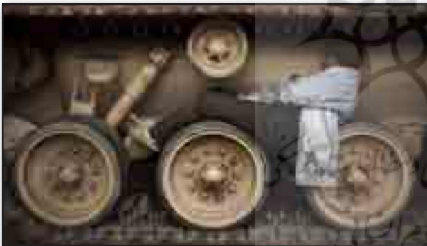
تصویر ۱۹. تانک و مردی که در شنی آن خوابیده تا از حرکت تانک جلوگیری کند. Fig. 19. A tank and a man, lying above the wheel in order to prevent the tank's movement.