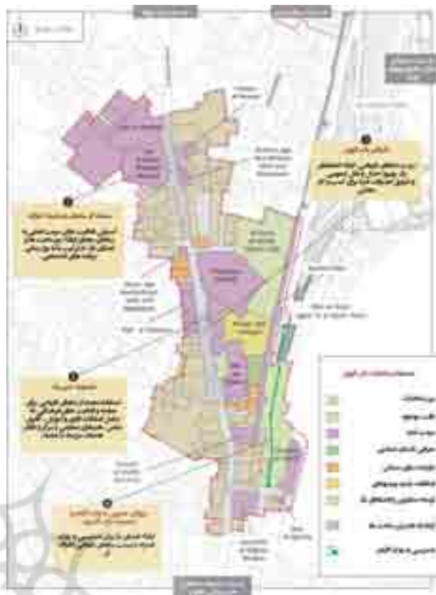
نقشه ۲. محدوده مداخلات در باب‌الوزیر. Map.2. The area of interference in Bab-al-vazir .

ساختن میدان از شبکه قدرت دولت، تمامی عناصر فیزیکی میدان را به سرعت برای یک زیست انقلابی طولانی مدت آماده ساختند (تصاویر ۵ تا ۲۰). در طی حدود یک هفته، محوطه‌های اسکان موقت (تصویر ۶)، پایگاه‌های رسانه‌ای (تصویر ۷)، درمانگاه، سرویس‌های بهداشتی، کیوسک‌های روزنامه‌فروشی و فروشگاه‌های سیار مواد غذایی (تصویر ۸) به سرعت برپا شدند. بخشی از جبهه شمالی میدان به مهدکودکی برای فرزندان مبارزان حاضر در محل بدل شد (تصویر ۹). نمایشگاه‌های هنری به همراه استندهای روزنامه (تصویر ۱۰) و یادمان شهدا (تصویر ۱۱). در جبهه شرقی میدان برپا شد؛ جایی که در منظرش، ساختمان‌های دوران استعمار به خوبی به چشم می‌آیند. نماز جماعت نیز در جبهه جنوب غربی، یعنی امن‌ترین نقطه میدان برپا می‌شد. خدمات عمومی، سطل‌های زباله و سرویس‌های بهداشتی در جبهه غربی میدان و در مجاورت یک کارگاه ساختمانی قرار گرفتند (تصویر ۱۱)، درمانگاه‌ها در خارجی‌ترین لایه‌های میدان برپا شدند تا امکان انتقال مجروحان را به بیمارستان‌های مجاور پیش‌ازپیش فراهم آورند. مسجد نزدیک میدان هم که در طول سالیان دراز تنها برای مراسم خاص مورد استفاده قرار می‌گرفت به کانون مباحثات و تصمیم‌گیری‌های مبارزان بدل شد. بنای مذهبی دیگر، یعنی کلیسای قصرالدوباره، میزبانی یک درمانگاه و پشتیبانی از مجروحان را بر عهده گرفت. نشانه‌های شهری موجود در میدان نظیر ساختمان المجمع لتحریر، فروشگاه کنتاکی، موزه و ورودی خیابان طلعت‌حرب نیز علاوه بر خروج برخی از آنان از کارکرد رسمی خود، به نقاط ارجاع برای جهت‌یابی مبارزان در میدان بدل شدند.