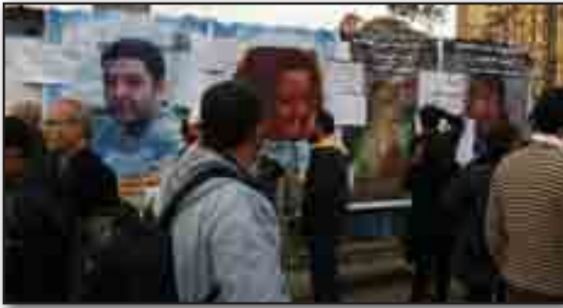
تصویر ۱۵. دیوار شهیدا. مأخذ : http://www.bbc.co.uk/news/world-12434787 Fig. 15. Wall of the martyrs. Source: http://www.bbc.co.uk/news/world-12434787 .