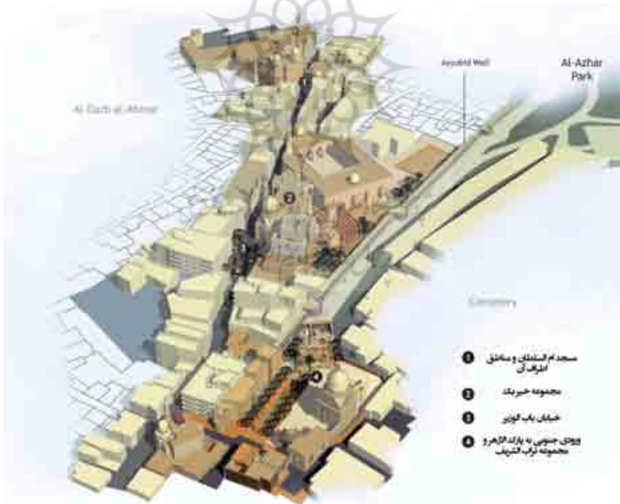
تصویر ۱. جانمایی اماکن مهم در باب‌الوزیر.

کالبد بهره برده است. آموزش کارگران محلی، استفاده از ظرفیت‌های بومی برای جذب سرمایه‌های غیردولتی و استفاده از مصالح بوم‌آورد و مطابق با وضع معیشتی، این پروژه را به‌صورت «پروژه ساماندهی-مرمت شهری با مردم» در آورده است. اما از منظر الگوی مشارکت فضا-مردم، این پروژه فاقد ویژگی‌های مشارکت حقیقی ارزیابی می‌شود. چراکه از طرفی، استفاده از مردم برای مرمت بافت شهری، در خاطره جمعی ساکنان محل احتمالاً به‌صورت «توجه مقامات بالا به ما» ثبت شده و تثبیت حکومت متمرکز شهری را به دنبال خواهد داشت. درواقع جنبه‌های ذهنی فضا توسط مردم به‌صورت مشترک تغییر نکرده و آنچه به عنوان خاطره جمعی مدنظر قرار گرفته، بیش از همه ناظر بر خاطرات مردم در ارتباط با پیوستار تاریخ خویش، نظیر حضور سلسله‌های گوناگون بوده است. به‌علاوه در این پروژه حق بر شهر همچنان نادیده گرفته شده و تغییرات ناظر بر فضا، با نظر متخصصان روی داده که این امر با ایده‌های بنیادین مشارکت شهری در تضاد است. از دیگر سو مردم به مثابه یک کنشگر فعال در فرآیند تغییر تاریخ و تغییر وجوه ذهنی فضا به شمار نیامده و به همکار دولت در تغییر