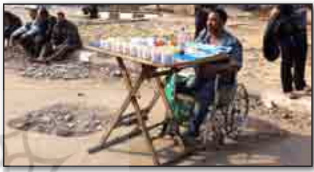
تصویر ۸. اغذیه فروش. مأخذ : http://www.bbc.co.uk/news/world-12434787 Fig. 8. The deli. Source: http://www.bbc.co.uk/news/world-12434787 .