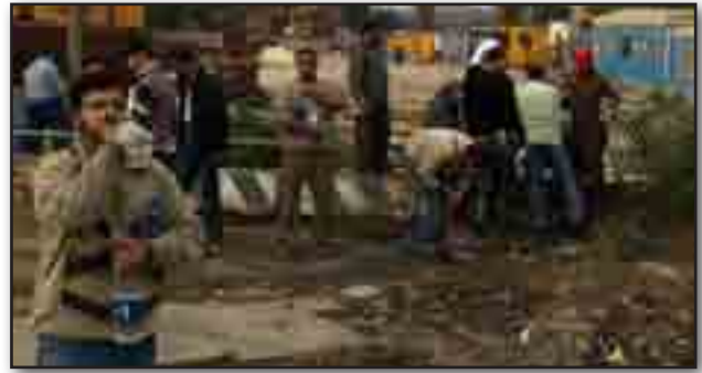
تصویر ۱۴. آبخوری. Fig. 14. drinking fountain.