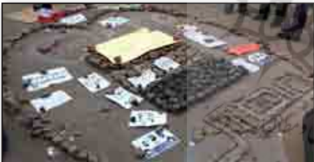
تصویر ۱۱. یادمان "قلب مصر"، یکی از آثار هنرمندان انقلابی . مأخذ : http://www.bbc.co.uk/news/world-12434787 Fig. 11. "The heart of Egypt" monument, one of numerous art works of the revolutionaries. Source: http://www.bbc.co.uk/news/world-12434787 .