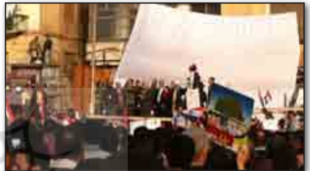
تصویر ۱۶. سکوی سخنرانی. مأخذ : http://www.bbc.co.uk/news/world-12434787 Fig. 16. The speech platform. Source: http://www.bbc.co.uk/news/world-12434787 (accessed 24 July 2013).