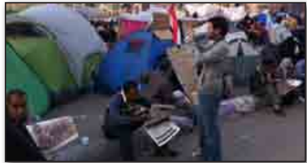
تصویر ۶. محوطه اسکان موقت. مأخذ : http://www.bbc.co.uk/news/world-12434787 Fig. 6. Temporary settlement areas. Source: http://www.bbc.co.uk/news/world-12434787 .