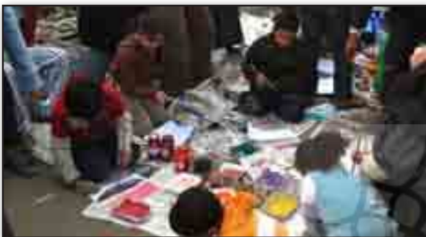
تصویر ۹. مهد کودک. مأخذ : http://www.bbc.co.uk/news/world-12434787 Fig. 9. Kindergarten. Source: http://www.bbc.co.uk/news/world-12434787 .