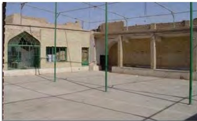
شکل ۶: حسینیه گلچینان