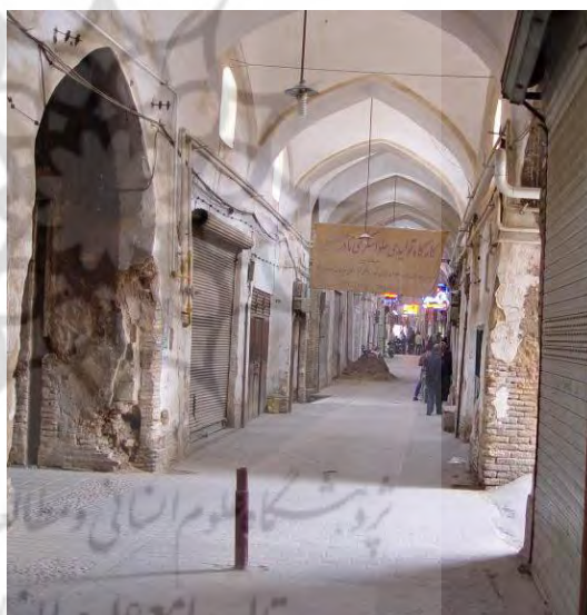
شکل ۹: بازارچه تبریزیان