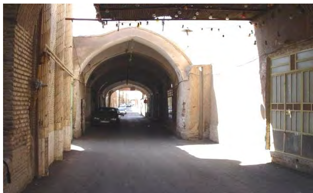
شکل ۸: بازارچه هاشمخان