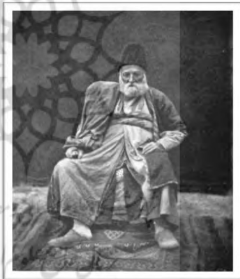
شکل ۳: یک تاجر زرتشتی یزد در سال‌های پایانی حاکمیت قاجار (۱۹۰۳ م) ۵۳

از بُعد بازرگانی، ساکنان زرتشتی یزد به واسطه ارتباط با همکیشان صاحب نفوذ و ثروتمند خود در هند، و نیز حُسن اعتماد اقتصادی که بازرگانان زرتشتی در میان سایر بازرگانان به دست آورده بودند، تا حد بسیاری شکوفایی اقتصادی یزد و صدور کالاهای