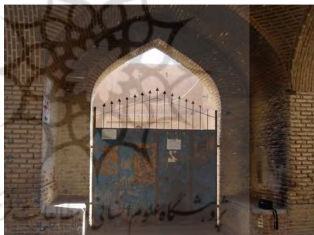
شکل ۷: آب انبار هاشم‌خان در محله گلچینان