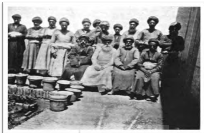
شکل ۲: انجمن زرتشتیان یزد در اواخر عصر قاجار (۱۹۰۳ م) ۵۲