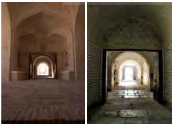
تصویر شماره ۷: سردر ورودی باغ قبل و بعد از مرمت (مداخلات دوره اخیر سردر را از وضعیت اصیل آن خارج ساخته بود)

بازسازی پله فرسوده تالار کوشک از جمله این اقدامات است. بازسازی اتاق شکم دریده جبهه شرقی کوشک که در اثر دخل و تصرفات معاصر شاکله فضایی آن دستخوش تغییر شده بود، از این جمله به شمار می‌رود. بازسازی به واسطه اینکه خوشبختانه شاکله اکثر بخش‌های مجموعه آسیب عمده ندیده بود، نسبت به دو گونه دیگر اقدامات حفاظتی، در سطح محدودتری انجام گرفته است.