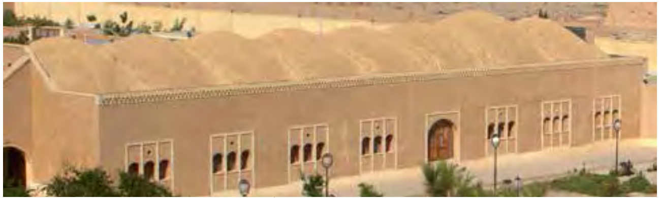
تصویر شماره ۱۰: رستوران از بناهای نوسازی شده در باغ می باشد.