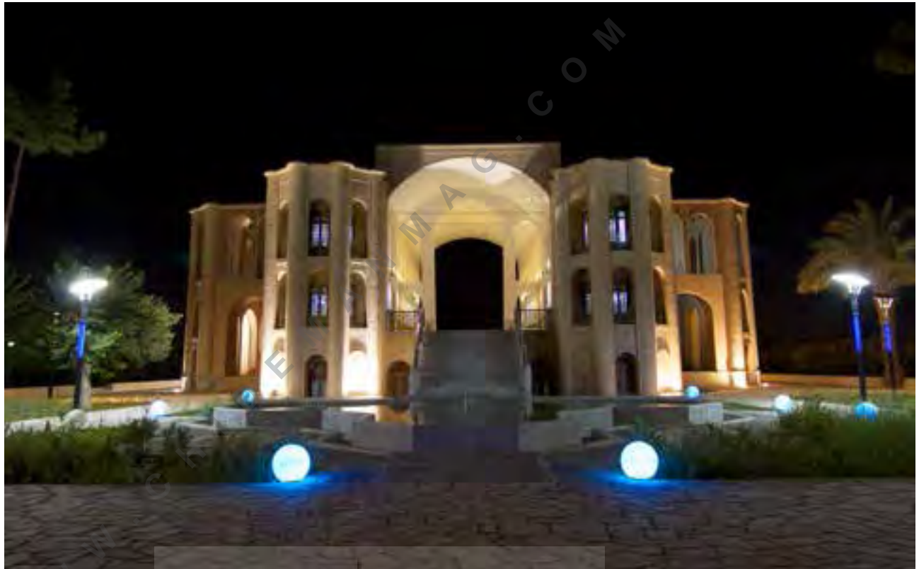
تصویر شماره ۲