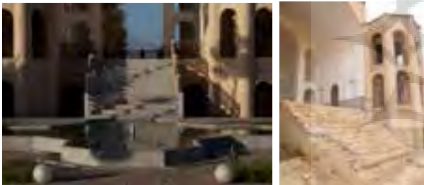
تصویر شماره ۹: بازسازی پله‌های تالار