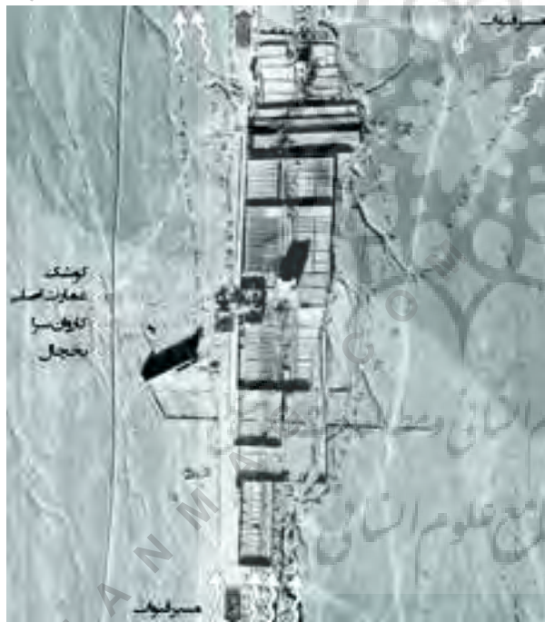
تصویر شماره ۳: باغ خان در سال ۱۳۳۵ ه.ش در امتداد مسیر یزد-تفت