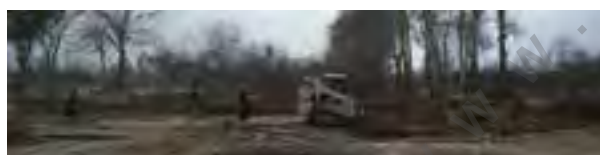
تصویر شماره ۴: تصاویر قبل از مرمت باغ

تصویری روشن از حفاظت، قبل از هر اقدام در روند حفاظت از یک بنا، ضروری است. در غیر این صورت اقدامات حفاظتی، چونان حرکت در تاریکی، گنگ، مبهم و پرخطر خواهند بود و بعضاً به ضد آنچه از آن‌ها انتظار می‌رود، بدل می‌شوند. براین اساس پیش از هر چیز در آغاز روند حفاظت از یک بنا می‌بایست مفهوم مطلوب حفاظت در پروژه مورد نظر، معرفی و مورد توافق همه دست‌اندرکاران ذی‌نفع و ذی‌نفع قرار گیرد تا در مراحل بعد کلیه مداخلات و اقدامات حفاظتی صورت گرفته را در منظومه‌ای که این مفهوم تعریف می‌کند، بتوان جانمایی و تبیین کرد.