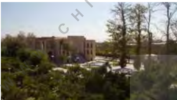
تصویر شماره ۸: فضای سبز باغ در طی عملیات حفاظت، احیاء شد

برای آنکه مجموعه بناها و محوطه دارای کارکرد شوند، در نهایت و پس از انجام عملیات ساختمانی، تجهیزاتی لازم است. این تجهیزات در واقع ابزار و وسایل زندگی در بنا برای کاربران هستند. این تجهیزات طیف وسیعی از لوازم از مبلمان و یراق آلات گرفته تا پرده‌ها و منابع نور و... را شامل می‌شوند. آنچه که به اجمال می‌توان در خصوص تجهیز در این پروژه ذکر کرد آن است که در تجهیز فضاها، چه انتخاب و خرید لوازم آماده در بازار و چه طراحی و ساخت آن‌ها، دو مؤلفه اساسی در نظر گرفته شده است. نخست جنس و ماهیت فضایی ابنیه و محوطه باغ و سبک و سیاق معماری آن‌ها و دوم نیازهای کاربری جدیدی که قرار است برای هر یک از فضاها در نظر گرفته شود. مبلمان و تجهیزات مورد نیاز هر فضا بر اساس دو مؤلفه فوق طراحی شده است.