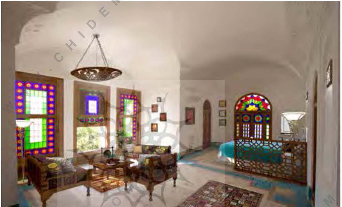
تصویر شماره ۱۱: فضای داخلی یکی از شکم دریده های کوشک که به اتاق اقامت مهمانان تبدیل شده است.