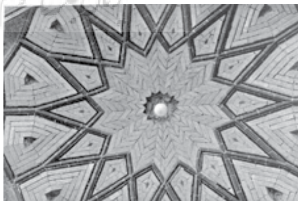
تصویر شماره ۶: کاربردی ۱۴ پادر گنبد حسینیه ملا فرج الله هروی

تعمیر خانه موسی خانی شهر بابک متعلق به دوره قاجار مرمت و بازسازی گنبد حسینیه کلوان در نایین بازسازی و مرمت گنبد ورودی بقعه سهل بن علی یزد حسینیه پشت باغ استاد تأکید زیادی در اجرای تمیز و حساب شده جزئیات ساختمانی داشتند و نگران نگاه منتقدین نسبت به سبکسری های طراحی و اجرا توسط معماران و بنایان معاصر بودند. ■