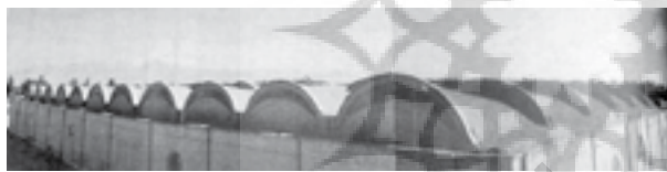
تصویر شماره ۳: نمایی از سالن کارخانه بهار تکس