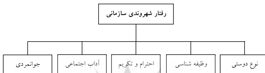
شکل ۱: الگوی رفتار شهروندی سازمانی

از قبیل حضور در فعالیتهای فوق برنامه و اضافی، آن هم زمانی که این حضور لازم نباشد. احترام و تکریم: شامل احترام به حقوق دیگران و مشورت با آنان است؛ این بعد بیان کننده چگونگی رفتار افراد با همکاران، سرپرستان و مخاطبان سازمان است.