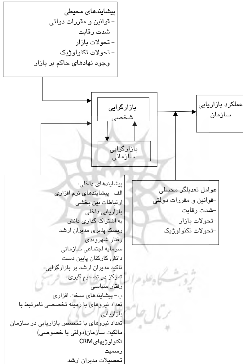
شکل ۲ مدل نهایی برآمده از مراحل مختلف تحقیق با روش دلفی