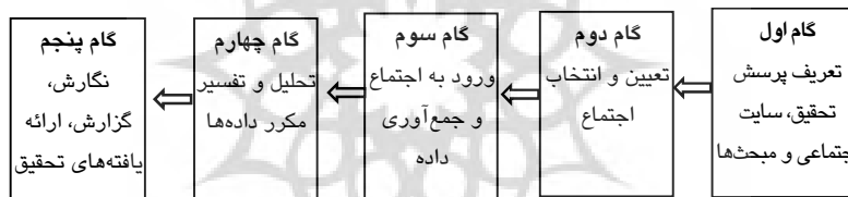
شکل ۱ خلاصه‌ای از گام‌های روش شبکه‌نگاری [۱۵، ص ۶۱]

و کنار گذاشتن اطلاعات نامرتبط و ایجاد مفهوم و تئوری‌سازی) [۲۴، ص ۱۴۳-۱۵۰]. تحلیل کیفی داده‌ها در روش شبکه‌نگاری به طور عموم به دو روش دستی و کامپیوتری (با کمک نرم‌افزارهای کامپیوتری تحلیل کیفی داده ۴۵ ) انجام می‌شود [۱۵، ص ۱۱۹]. در این تحقیق، تحلیل کیفی داده‌ها با روش کامپیوتری و با کمک نرم‌افزار مکس کیودا ۴۶ (نسخه ۱۰) که از زبان فارسی پشتیبانی می‌کند، انجام شده است. از جمله مهم‌ترین امکانات این نرم‌افزار در تحلیل داده‌ها، قابلیت ورود انواع مختلف فایل‌های متنی (ورد و پی‌دی‌اف)، کدگذاری راحت متون، برقراری ارتباط بین کدها و فراهم کردن خروجی‌های گرافیکی به منظور تحلیل دقیق‌تر و بهتر می‌باشد. با توجه به هدف تحقیق (بررسی یک اجتماع ایرانی) از بین انجمن‌های ایرانی یک انجمن معروف انتخاب شد. انجمن «پی‌سی‌ورلد» ۴۷ یک انجمن تخصصی گفتگو بوده و کاربران در آن به بحث درباره سخت‌افزارها و انواع لوازم صوتی تصویری، کامپیوتر، موبایل و لوازم خانگی و حتی اتومبیل می‌پردازند.