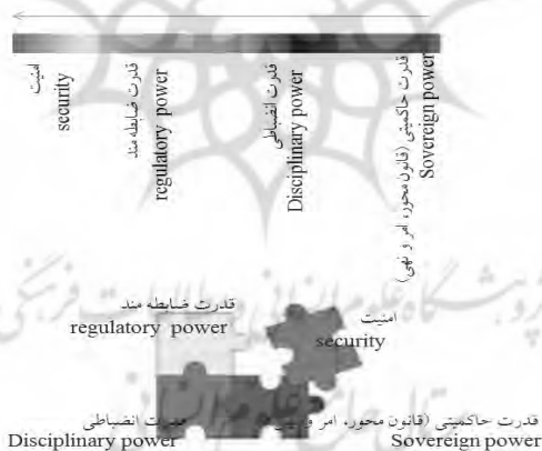
شکل ۱. دو شیوه تحلیل قدرت در آثار فوکو (درک خطی و درک توپولوژیکال)

به آن است. در مقابل، چنانکه مشاهده شد، حکومت‌رانی قائم به فناوری‌های قدرتی است که، هم‌زمان، فناوری‌های نفس از یک سو و تکنولوژی‌های سلطه بر دیگران هستند. به بیان دیگر، «حکومت‌رانی بر رابطه اخلاقی نفس با نفس دلالت دارد و ناظر بر استراتژی‌هایی است برای هدایت رفتار افراد آزاد» (Dean, 1994: 174). در اینجا با دو دسته کردار و رویه‌ها سروکار داریم که به بیان دین (۱۹۹۴) «کردارهای نفس» ۱ و «کردارهای حکومت» ۲ هستند. هم‌آمیزی این دو دسته رویه‌ها و کردارها به نظام دقیق‌تر و کارآمدتری از اعمال قدرت در جامعه منجر می‌شود. با این رویکرد می‌توان به سادگی درک کرد که چگونه متابعان دولت - ملت‌های غربی به شهروندانی مطیع قانون تبدیل شدند. در این فرایندها سوژه‌های اجتماعی خاصی شکل گرفتند که خود، عامل اقدام کنترل بر خود شدند. به بیان دیگر، عمل قانونی، دیگر رفتاری حاصل از فشار نیروهای بیرونی نیست، بلکه به بخشی از اخلاقیات و وجدانیات افراد تبدیل می‌شود. ۳ جالب آنکه به نظر فوکو این تغییر، از سوژه‌های تابع به شهروندان نظم‌پذیر، نه محصول ایدئولوژی قانون و نظم در جامعه که در سنت مارکسیستی به‌ویژه مورد تأکید بوده است، بلکه حاصل تکنیک‌های حکومت است.