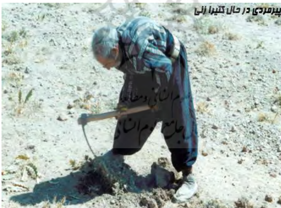
تصویر ۱- پیرمردی با سابقه طولانی در کتیرا زنی

سلول‌های پارانشیمی با جذب آن به تدریج به صمغ تبدیل می‌شود. فشار تولید شده سبب رانده شدن صمغ به طرف شکاف می‌گردد. صمغ در مجاورت هوا در اثر تبخیر آب به تدریج سخت می‌گردد و به شکل محصول خشک شده، بسته به نوع شکافی که بر روی ساقه ایجاد شده است در می‌آید. بنابر تحقیقات صورت گرفته، در ایران حدود پانصد گونه گون یا مول کتیرا به عمل می‌آید و در هر نقطه‌ای از ایران نوع خاصی از کتیرا می‌روید. کتیرا به رنگ سفید، زرد، قهوه‌ای کم رنگ و پر رنگ دیده می‌شود. روش‌های به دست آوردن کتیرا گوناگون است. در همه این روش‌ها معمولاً سه نوع کتیرا به دست می‌آید که عبارتند از: ورقه‌ای، معولی و مفتولی. کتیرای ورقه‌ای از تیغ زدن ساقه به دست می‌آید، کتیرای مفتولی را از فرو بردن سیخ یا میخی در ساقه به دست می‌آورند و کتیرای معمولی که چندان مرغوب نیست به شکل لوله یا مدورات و از تیغ زدن به دست می‌آید. قسمت عمده کتیرای ایران از نوع ورقه‌ای است.