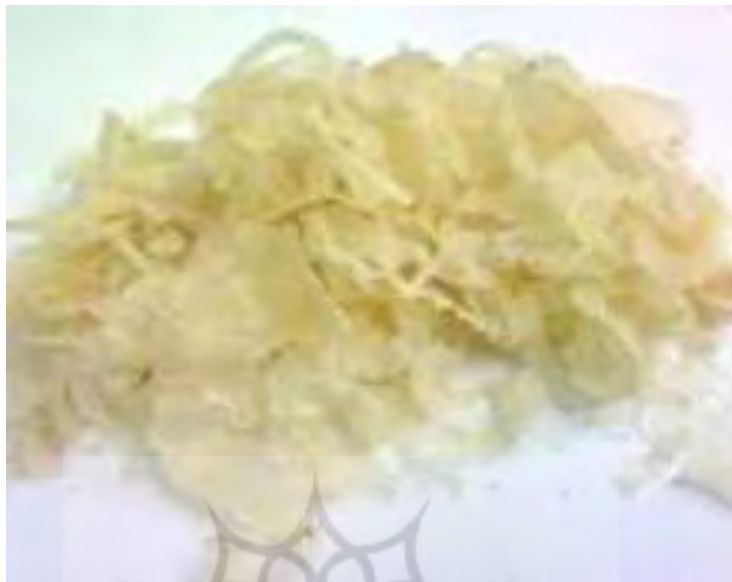
تصویر ۲- نمایی از کتیرای مرغوب