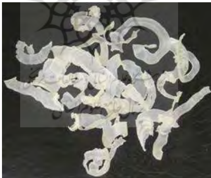
تصویر ۳- نمایی از کتیرای مرغوب معروف به شاخ قوچی