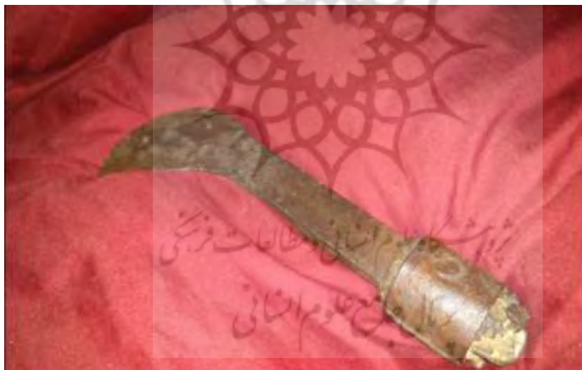
تصویر ۴- نمایی از تیغ کتیرا زنی

تیغ: تیغ‌های فلزی از جنس آهن است که قسمت بالای آن قوسی شکل است و در قسمت انتهایی آن سوراخی وجود دارد که چوبی به طول تقریبی یک متر در آن تعبیه شده است. این چوب معمولاً از جنس درخت آهر یا ارژن تهیه می‌شد که بسیار بادوام بود.