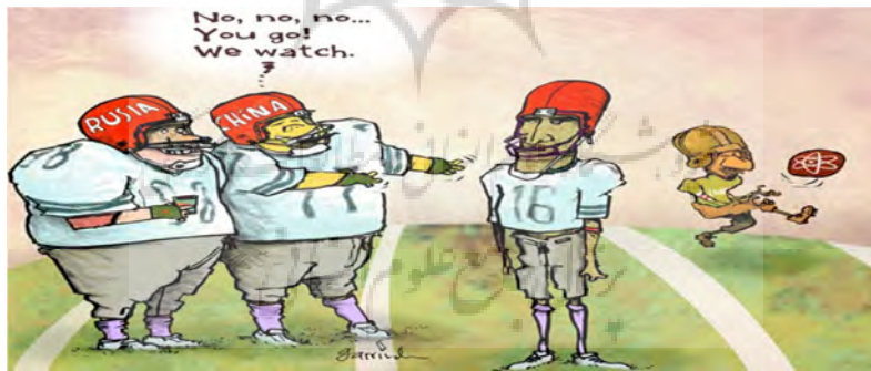
نمونه ۱. دولت آمریکا، ایران، هسته‌ای، اوپاما، روسیه ... گوستاوو رودریگوز، ال نونو هرالد، ۱۵ نوامبر ۲۰۱۱