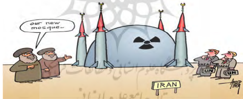
نمونه ۲. ایران و آژانس بین‌المللی انرژی اتمی، آرنند ون دام، ۷ نوامبر ۲۰۱۱

جدید هسته‌ای ادامه می‌دهد. اکنون مخالفت آن با کشوری که سلاح هسته‌ای ندارد و در صدد استفاده صلح‌آمیز از انرژی هسته‌ای است، ریشه در اسطوره غربی «ما» در مقابل «آنها» دارد و این اسطوره در آمریکا نسبت به جاهای دیگر بیشتر مشهود است. همچنین در راستای سرمایه‌داری جهانی و منافع غربی در انرژی به‌ویژه در خاورمیانه است. در گفتمان این کارتون، غرب در مقابل ایران اسلامی، تعیین‌کننده تمایز میان «ما (خود)» و «آنها (دیگری)» است. همان‌طور که مطرح شد، مسئله انرژی هسته‌ای ایران مسئله جهانی است اما بیشترین تأکید در این کارتون، تمایز بین ایران اسلامی (به‌منزله آنها و دیگری) و آمریکا (به‌منزله ما و خود) است. دولت ایران به‌دلیل اینکه اسلامی است، غیرقابل اعتماد است و تلاش‌های دیپلماتیک روسیه و چین برای مهار ایران در دسترسی به بمب هسته‌ای امتیاز دادن به کشوری است که اسلامی بوده و اسلام یک تهدید است. این اساس عقیدتی و اسطوره غربی ما در مقابل آنها در این کارتون است. در حقیقت، اختلاف با جهان اسلام و در نتیجه ایران، نیاز درونی جامعه غربی برای تهدید و در عین حال غلبه و سلطه بر دیگری است.