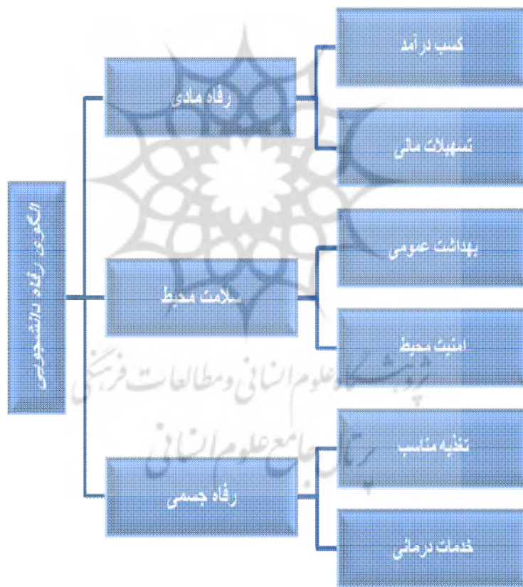
مدل رفاه دانشجویی