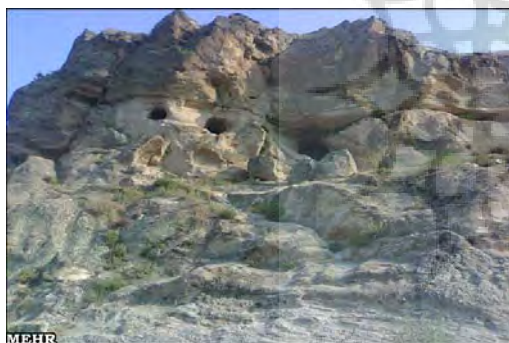
شکل ۹- سکونتگاه زیرزمینی ویند کلخوران، منبع: