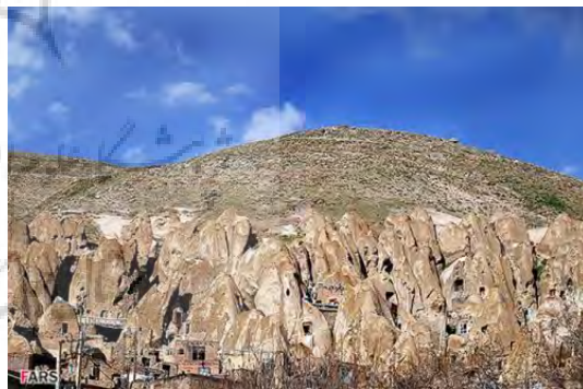
شکل ۱- سکونتگاه زیرزمینی کندوان

در این محیط عوامل کالبدی محیط زیست انسان از بین عوامل کاملاً طبیعی انتخاب شده و تلفیق عجیبی بین کالبد مسکونی و رفتار انسان بعمل آمده و در واقع این هردو در هم تأثیر گذاشته‌اند. نکته مهم اینکه هنوز بعد از گذشت قرن‌ها، تغییر چندانی در زندگی انسان‌های ساکن این مجموعه دیده نمی‌شود. طبیعت ثابت، فرم زندگی را ثابت نگه داشته زیرا عامل فیزیکی در این بحث، سنگ است، سنگی که جزئی از یک کوه رفیع است و لاجرم تغییر ناپذیر و با دوام و شکل ظاهری زندگی اجتماعی کوچک کندوان در رابطه جدا نشدنی با فرم کالبدی این محیط قرار گرفته و انسانها، سنگین و تغییر ناپذیر در مقابل عوارض طبیعی مثل پولاد سخت و غیر قابل نفوذ باقی مانده‌اند و چنان است طرز فکرشان در مقابل سیر تغییرات و تحولات (مجتهد زاده، ۱۳۵۳: ۱۵۰).