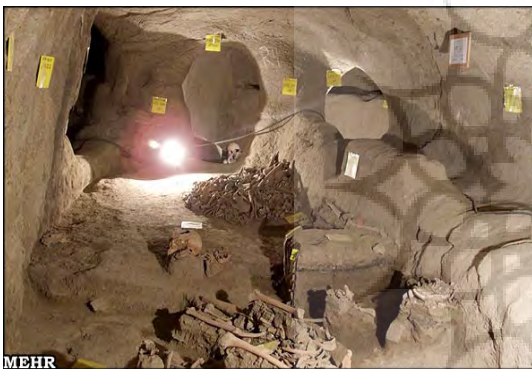
شکل ۴- سکونتگاه زیرزمینی سامن

انسان‌ها در این ساختار مشاهده می‌شود. (پایگاه اطلاع‌رسانی سامن، ۱۳۹۱)