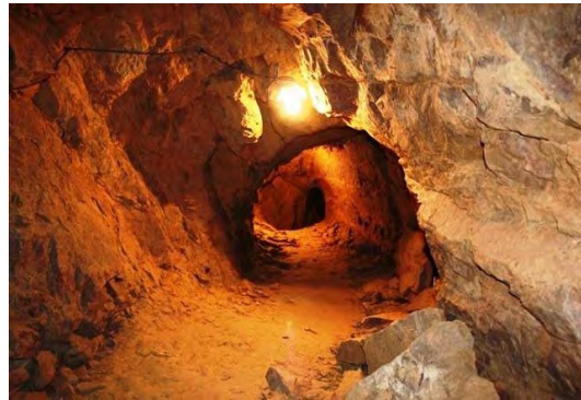
شکل ۶- سکونتگاه زیرزمینی دژمنده خوئین، منبع: اطلاع رسانی روستای تاریخی خوئین، ۱۳۹۱

ذلف‌آباد: مستندات به دست آمده از کاوش‌های ذلف‌آباد حکایت از شهری مدفون در دل خاک متعلق به دوره ایلخانیان و سلجوقیان دارد که به لحاظ جایگاه اقتصادی، سیاسی و ارتباط قوی با مناطق همجوار از شرایط استراتژیکی برخوردار بوده است. این محوطه، تا ۲۰۰ سال قبل نیز محل زندگی مردم بوده که در این سالها توسط حکومت قاجاریه به آب بسته شده و مردم فراهان در استان مرکزی نیز مجبور به ترک این شهر می‌شوند. این شهر به احتمال زیاد دارای بخش‌های مختلف و طبقه بندی مشاغل بوده و از وجود ساختارهای عمومی در ارتباط با مذهب و زندگی روزمره و محله‌هایی برای معیشت طبقات اجتماعی چندگانه بهره می‌برده است. نتایج حاصل از مرحله نخست کاوشها حاکی است که محوطه