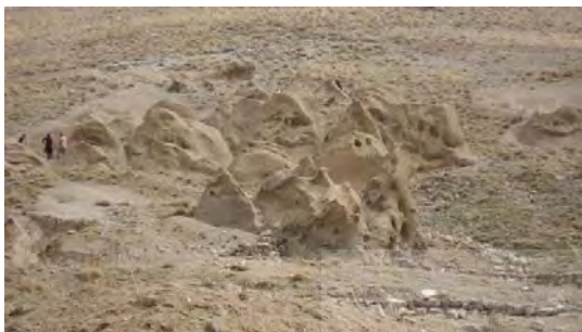
شکل ۵- سکونتگاه زیرزمینی حیل‌ه‌ور

کندوان از نظر علمی باید عقبه قوی داشته باشد و حیل‌ه‌ور و کندن آن در دل کوه‌ها و زیرزمین پیشینه‌ای بود برای کندن ماهرانه کندوان و انتخاب هوشمندانه آن. (سایت سازمان میراث فرهنگی استان آذربایجان شرقی، ۱۳۹۱)