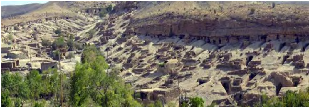
شکل ۳- سکونتگاه زیرزمینی میمند، پایگاه اینترنتی سازمان میراث فرهنگی میمند، ۱۳۹۱

انسان‌ها در این ساختار مشاهده می‌شود. (پایگاه اطلاع‌رسانی سامن، ۱۳۹۱)