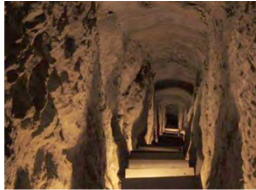
شکل ۲- سکونتگاه زیرزمینی اویی (نوش آباد)

انسان قرار دارد. در بدو امر تصویری که روستا در مقابل دیدگان بیننده از خود ارائه می‌کند تنها درهای کوتاه سیاه رنگی است که ظاهراً به دهلیز یا حفره‌ای که پشت آن قرار گرفته اند چسبیده است. این درها همه در یک سطح نبوده بلکه در طبقات مختلف گاهی تا ۵ طبقه روی هم قرار گرفته‌اند (حاتمی، ۱۳۸۰: ۱). همه خانه‌های این روستا در دل کوه، همانند یک سری غارهای بزرگ کنده شده و تنها ارتباط بین داخل و خارج این ابنیه زیرزمینی، در ورودی است. این در هم محل ورود و خروج اهالی خانه و هم جهت تأمین نور و تهویه است. این ساختمان‌ها از نظر آسایش حرارتی بسیار پایدار هستند، زیرا بدنه آنها سنگ یکپارچه است. نوسان درجه حرارت در طی شبانه روز بسیار اندک است و باد و باران به داخل آن نفوذ نمی‌کند و در مقابل آتش سوزی مقاوم است. البته در داخل خانه‌ها تهویه به خوبی صورت نمی‌گیرد و روشنایی طبیعی آنها نیز کافی نیست (قبادیان، ۱۳۸۷، ۲۹) در سال ۲۰۰۵، جایزه نخست ملینا مرکوری، به سبب حفظ و تعامل با طبیعت به روستای میمند اختصاص یافت. این روستا "هفتمین منظر زندگی"، طبیعی و تاریخی جهان است که جایزه مرکوری را دریافت کرده است. جایزه ملینا مرکوری جایزه‌ای است که از سوی دولت یونان و با همکاری مجامع فرهنگی - بین‌المللی مانند یونسکو و ایکوموس (شورای حفاظت از بناها و محوطه‌های تاریخی) به آثاری اهدا می‌شود که دارای شرایط و ضوابط فرهنگی، طبیعی و تاریخی منحصر به فرد باشد (دهقان، حمید، ۱۳۹۰، ۴۲)