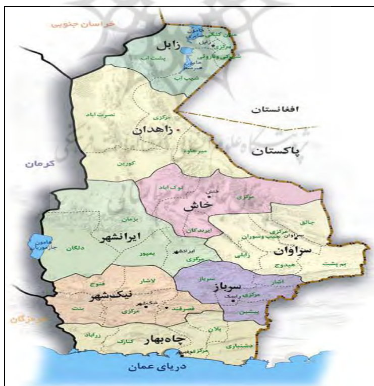
شکل ۲- موقعیت مرزی استان سیستان و بلوچستان