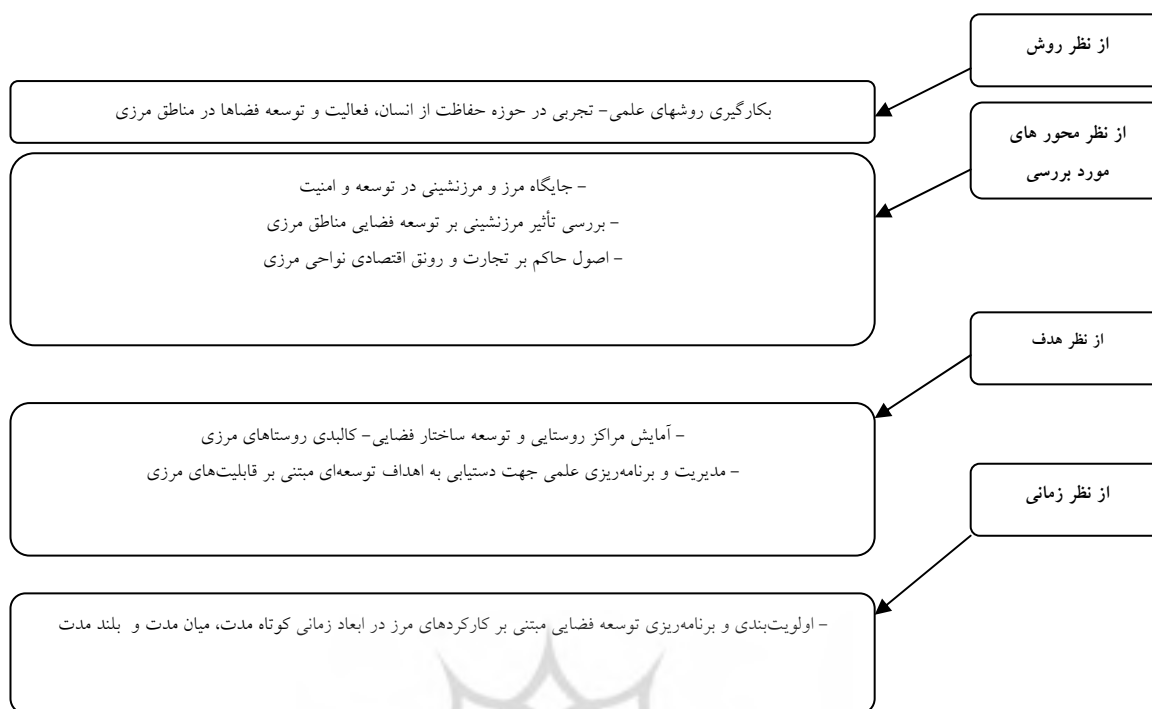
شکل ۱- مدل مفهومی مطالعات طرح