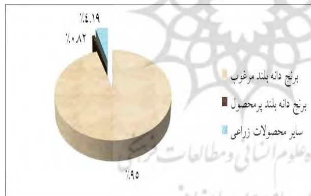
الگوی کشت ناحیه شرق گیلان ۵۴۵۵۶ هکتار وسعت اراضی