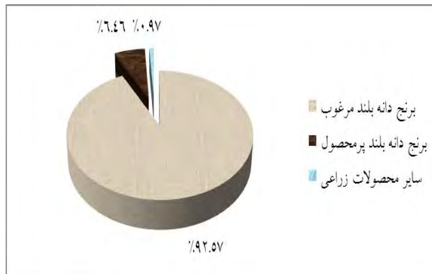
الگوی کشت ناحیه دشت مرکزی ۷۸۵۷۳ هکتار وسعت اراضی