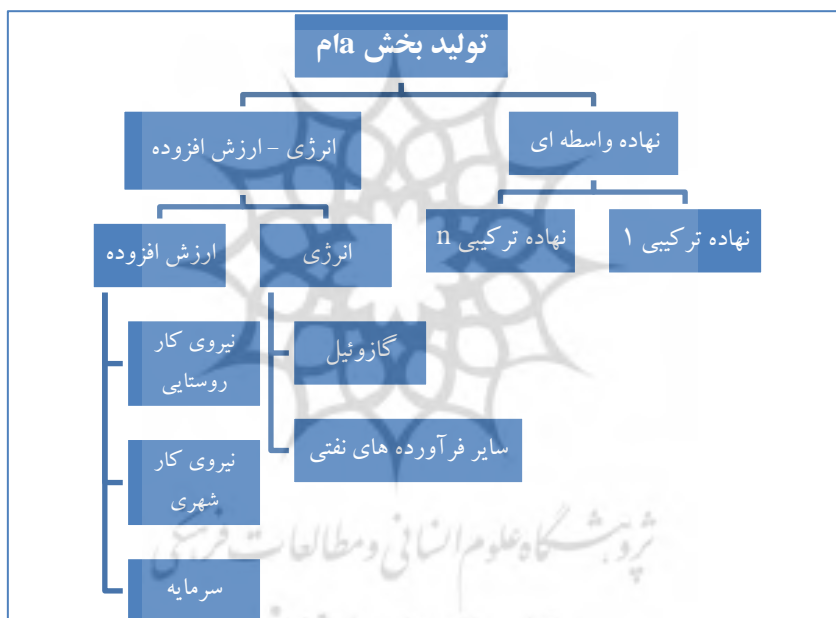
نمودار ۱. ساختار مربوط به تولید هر کدام از فعالیت‌های اقتصادی

در سطح اول تولید، از ترکیب ارزش افزوده کل - انرژی کل با نهاده‌های واسطه‌ای کل سطح تولید بخش a به دست می‌آید. در سطح دوم تولید، از ترکیب نهاده‌های ترکیبی ۱ تا n ، نهاده واسطه‌ای تجمیع شده و، همچنین، از ترکیب انرژی و ارزش افزوده، ارزش افزوده کل - انرژی کل بدست می‌آید. در سطح سوم تولید نیز از ترکیب نیروی کار شهری، نیروی کار روستایی و سرمایه، ارزش افزوده به دست آمده و، همچنین، از ترکیب گازوئیل و سایر فرآورده‌های نفتی، نهاده ترکیبی انرژی حاصل می‌شود.