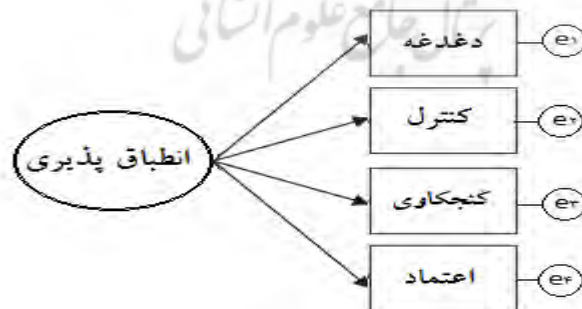
شکل ۲. مدل تحلیل عاملی مرتبه اول مقیاس انطباق‌پذیری مسیر شغلی

۱- به منظور گردآوری شواهد مربوط به روایی سازه مقیاس انطباق‌پذیری مسیر شغلی، از روش‌های تحلیل عاملی تأییدی و روایی همگرا استفاده شده است. الف) تحلیل عاملی تأییدی: از آنجا که سازندگان آزمون از طریق روش‌های آماری، دقیقاً تعداد عوامل مربوط به مقیاس انطباق‌پذیری را مشخص کرده‌اند، در این پژوهش ساختار عاملی آزمون از طریق تحلیل عاملی تأییدی با استفاده از نرم افزار Amos ۲۰ بررسی شد. نتایج در شکل ۲ نشان داده شده است. این مدل دارای یک متغیر مکنون است که همان انطباق‌پذیری مسیر شغلی است و ۴ متغیر آشکار که عبارتند از دغدغه، کنترل، کنجکاوی و اعتماد. کنجکاوی و اعتماد.