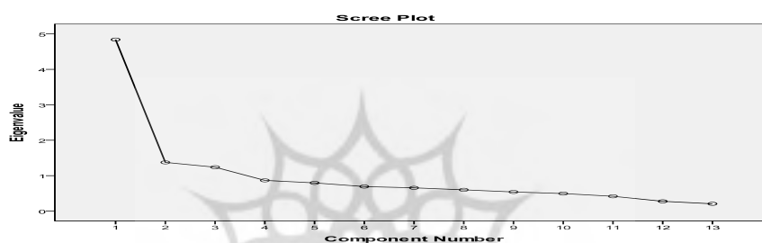
نمودار ۱. آزمون اسکری

پایایی نشان داد که آلفای کرونباخ کل پرسشنامه ۰/۸۵ و به همین ترتیب برای خرده‌مقیاس‌های خلاقیت زدایی ۰/۸۳، برای میل‌گرایی ۰/۷۰ و برای احساس تنهایی ۰/۷۰ به دست آمد؛ بنابراین با استناد به این تحلیل بخش نخست سؤال دوم تحقیق تأیید می‌شود. تعداد عوامل پیشنهادی از طریق آزمون اسکری در نمودار ۱ ارائه شده است. ضمناً عوامل، ماده‌ها و بار عاملی هر کدام یک در جدول ۲ آمده است.