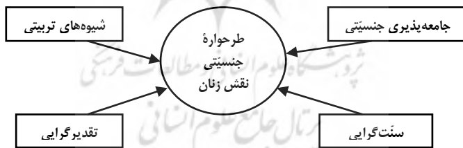
نمودار ۱: مدل تجربی تحقیق

بر اساس مباحث فوق، مدل نظری و فرضیه‌های پژوهش به شرح زیر تدوین شد: