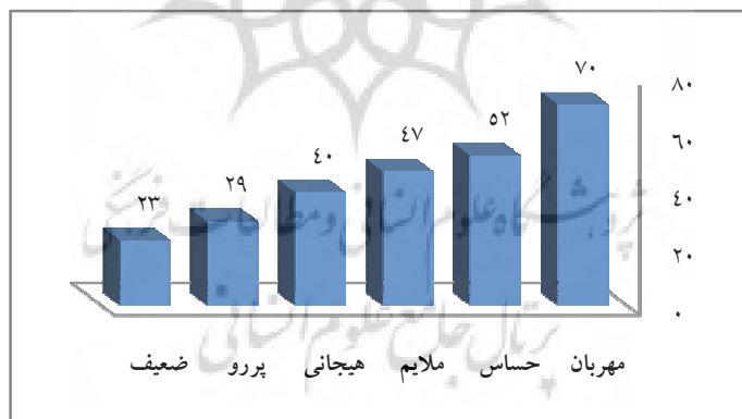
نمودار ۱. الویت‌بندی ویژگی‌های جنسیتی زنانه از منظر پاسخ‌گویان

ویژگی‌های زنانه: هیجانی □، مهربان □، حساس □، پیرو □، ضعیف □، ملایم □، سایر □. بر این مبنا، آرای پاسخ‌گویان در نمودارهای زیر به تصویر کشیده شده است.