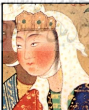
تصویر ۱۰. تدبیر کنیزکان رودابه برای دیدار با زال، منسوب به میر مصور، شاهنامه فردوسی، جزئی از اثر.

رویی ز حساب وصف بیرون گلگونه نکرده لیک گلگون