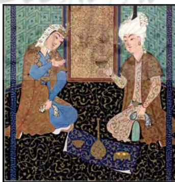
تصویر ۱. امیر و ملکه، تیموری، بخشی از اثر.

این صفت معنوی زنانه در آثار نگارگری به‌درستی به‌ظهور می‌رسد؛ چنان‌که قابلیت منطبق شدن با غالب نگاره‌های اصیل را دارد. در نگاره‌هایی که به‌دست و قلم استادان این هنر رقم خورده‌اند زنان همواره مستور و محجوب ترسیم شده‌اند. زنان حتی در حریم اندرونی خانه و محافل خصوصی نیز پوششی کامل دارند. تصویر ۱ مجالست خصوصی یک امیر و ملکه را نشان می‌دهد. پوششی که برای ملکه در این مجلس خصوصی انتخاب شده پوششی کامل است که دالبر صفت مستوری زنان در نگاره‌هاست. افزون بر این، نگارگر با تمهیداتی در طراحی پیکر ملکه و انتخاب حالت خاص نشستن برای او، بر این صفت تأکید می‌کند. هر دو اندام زنانه و مردانهٔ ملکه و امیر در وضعیت مشابهی که قریب به قرینگی است طراحی شده‌اند، اما حالتی که در وضع قرارگیری یک پای ملکه در برابر بدنش جود دارد، سبب تمایز وضع نشستن او با پیکر امیر شده است. این نحو از نشستن نشانی از حجب و حیای زنانه و مستوری اوست که در نگاره‌ها مشهود است.