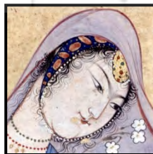
تصویر ۱۲. بانوی ایستاده، جزئی از اثر، رضا عباسی، اصفهان، ۹۵-۱۵۹۰.

خال مشکین که بدان عارض گندم‌گون است سر آن دانه که شد رهنز آدم با اوست گذشته از صورت مه‌رویان و زیبارویان، که توجه خاصی به آن‌ها می‌شود، چهره‌ها در نگارگری همواره زیبا ترسیم می‌شوند؛ زیرا در نگاره‌ها حقیقت انسانی همه چهره‌ها واحد بوده است و صورت مجرد آن‌ها در همه حال حفظ می‌شود، اما استعانت نگارگران از ممیزات زیبایی‌شناسانه‌ای که در توصیف اجزای چهره در اشعار فارسی وجود دارد رمز و راز چهره‌زنان در نگاره‌ها را دوچندان کرده است. تصویر ۱۲ نمونه‌ای از به‌کارگیری این ویژگی‌ها در ترسیم چهره‌زنان است.