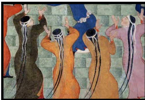
تصویر ۹. دیوان امیر خسرو دهلوی، حرمسرای سلطان حسین بایقرا، بخشی از اثر، منسوب به شاه مظفر، هرات، ۸۸۶/۱۴۸۱

پیکر زن به گل نیز تشبیه می‌شود. گل نماد و نشانی از وجود زن است که به زیبایی معنوی و صفای باطن او نیز اشاره دارد. سعدی زن نیک زیبا را «گل اندام» خوانده و می‌گوید: