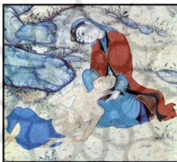
تصویر ۱۶. لیلی به دیدار مجنون می‌رود، بخشی از اثر، احتمالاً هرات.

بر همین اساس، برای اشاره به حقیقت و پاکی عشق در قصهٔ «لیلی و مجنون» گرچه روپوش لیلی به رنگ سرخ و نشان عشق است، اما لباس زیرین لیلی به رنگ آبی خالصی است که نشان از پاکی و عفت او دارد (تصویر ۱۶).