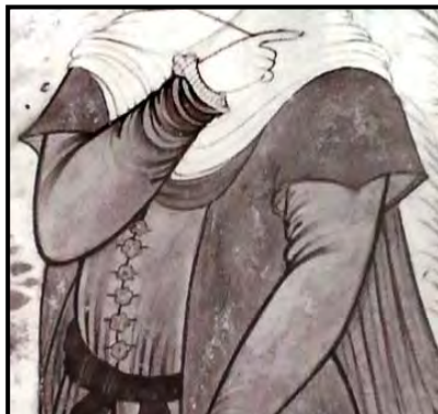
تصویر ۱۳. بانوی ایستاده، جزئی از اثر، رضا عباسی، اصفهان، حدود ۲۸-۱۶۵۲.

رعایت اصول متعدد دیگر، از جمله کاربرد رنگ‌های خالص و ناب و پرهیز از پرسپکتیویته حاصل از خطای بصری نیز به این امر کمک می‌کند و تصویری مثالین را محقق می‌سازد. چنین تمهیداتی سبب ظهور صفت «جوانی» در تصویر زن در نگاره‌هاست که از مهم‌ترین نشانه‌های صورت مثالی به‌شمار می‌روند؛ زیرا در این صورت، که به عالم ملک تعلق ندارد، پیری حقیقت ندارد. این امر بدان معنی نیست که از تصویرکردن زنان در سنین مختلف پرهیز شده است، بلکه جوهره ذاتی شکل و رنگ در نگاره‌ها «جوان» است؛ هرچند فردی را در سنین پیری به نمایش درآورده باشد.