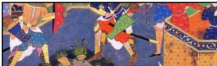
تصویر ۱۴. کشته‌شدن ارجاسب به دست اسفندیار، جزئی از اثر، شاهنامه فردوسی، تبریز

نگاهی چندسویه در نگاره‌ها به پیکر انسانی نیز از دیگر عوامل تحقق صورت مثالی است. گرچه نقطه دید غالب به پیکر انسان زاویه سه رخ است، اما می‌توان دید افق و سه رخ را هم‌زمان در برخی پیکره‌ها مشاهده کرد (تصویر ۱۵). دید افق معمولاً برای نمایش پاها و گاه نیم‌رخ چهره‌ها و دید سه رخ برای سایر اندام انسانی به کار می‌رود. جمع این دو زاویه دید، تصویر کاملی از پیکر انسان را به نمایش می‌گذارد که در عین زیبایی، قابلیت بیان حالات و حرکات بسیاری نیز دارد.