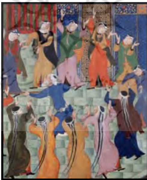
تصویر ۳. حرمسرای سلطان حسین بایقرا، دیوان امیر خسرو دهلوی، بخشی از اثر، منسوب به شاه مظفر، هرات، ۸۸۶/۱۴۸۱

صفت مستوری حتی زنان رقصنده را نیز شامل می‌شود. این حالت زنان از منظر نگارگر به‌گونه‌ای تصویر می‌شوند که گویی در عالم دیگری قرار دارند و رقص ایشان نه‌تنها عیش و عشرت نیست، بلکه نوعی وجد و شغف روحانی به‌شمار می‌رود. این حالت سرور روحانی، با پوشیدگی کاملی که در ترسیم پیکر ایشان وجود دارد، مضاعف نیز شده است. زنان در این حالت، گرچه در حالت بی‌پرده‌تری در مقایسه با سایر حالات زنانه در نگاره‌ها قرار دارند، اما حتی در ایشان نیز کمال حیا مشهود است. حالت رقص این زنان، هیچ شائبۀ شهوانی ندارد و بیش‌تر معرف وجد و سرور است تالهو و لعب. در تصویر ۳ برای زنانی که می‌رقصند اندامی ساده و متین طراحی شده است که بی‌شبهت به حالات کودکانه نیست.