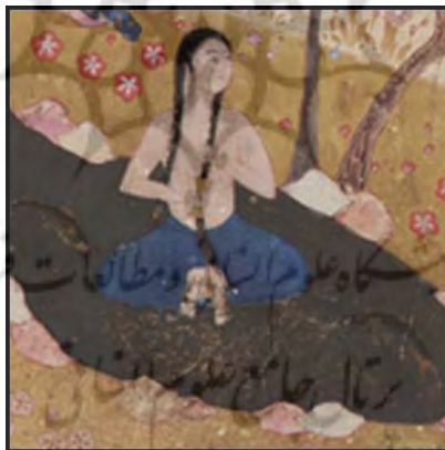
تصویر ۲. نظاره خسرو بر شیرین، خمسه نظامی، بخشی از اثر، حدود ۹۴۹/۹۴۵

همچنان‌که نظامی حالت شرم شیرین را در این شعر به کلام آورده است، نگارگر نیز تصویر معصومانه و پاکی از بدن برهنه او ارائه کرده است که در نوع خود، بسیار ماهرانه بوده و از هرگونه جلوه‌گری ممیزات جنسیتی به دور است.