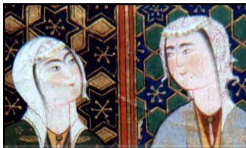
تصویر ۷. شاهنامه شاه‌طهماسب، صفوی، جزئی از اثر.

نگارگران نیز کوشیده‌اند زنان را گردن‌فراز ترسیم کنند؛ به نحوی که در تناسبات اندامی به‌کاررفته برای زنان در غالب آثار، گردن‌هایی کشیده منظور شده است. تصویر ۷ نمونه‌ای از این امر را نشان می‌دهد.