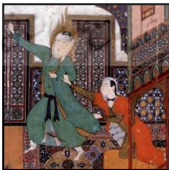
تصویر ۱۷. یوسف و زلیخا، کمال‌الدین بهزاد، بوستان سعدی، حدود ۱۴۸۸.

در داستان «یوسف و زلیخا»، اثر جاودان کمال‌الدین بهزاد نیز، رنگ لباس یوسف به نشانهٔ عصمت سبز، و رنگ لباس زلیخا به علامت عشق، قرمز انتخاب شده است (تصویر ۱۷).