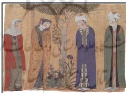
تصویر ۵. ملاقات همای و همایون، سمرقند یا هرات.

تصویر ۴. آگاهی یافتن سیندخت از حال رودابه، منسوب به عبدالعزیز، شاهنامه فردوسی، صفوی، جزئی از اثر. در تصویر ۵ نیز زمان ملاقات همای و همایون، که دو دلداده‌اند، ترسیم شده است. در حالت چهره همایون به خوبی می‌توان جلوه حالت شرم را مشاهده کرد. همایون و همای، که به همراه ندیم و ملازم به دیدار هم آمده‌اند، در کنار درختی یک‌دیگر را ملاقات می‌کنند. نگارگر با قراردادن درخت و بوته‌های گل در میان این دو دلداده، علاوه بر ایجاد فضایی لطیف، گویی بر حریم محفوظ میان این دو تأکید می‌ورزد. همای، که به ادب دست زیر ردا پنهان داشته، با گردنی که به علامت احترام اندکی خم شده است به همایون می‌نگرد. همایون نیز، که سراپا پوشیده است، یک دست خود را از زیر لباس حائل صورت کرده و به نوعی روی پنهان کرده است. خم شدن سر همایون و فرورفتن اندک گردن در شانه همراه با قامتی که در آن افتادگی دیده می‌شود در تشدید حالت حیا بسیار مؤثر است.