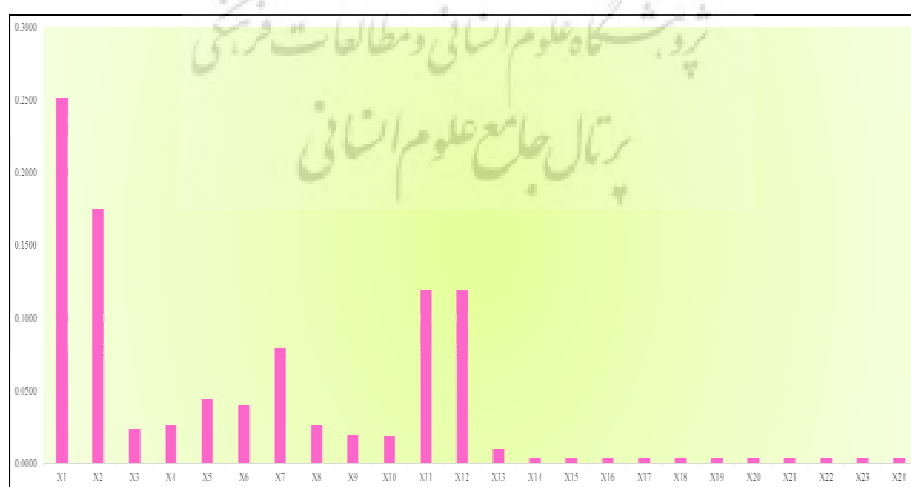
شکل ۴- وزندهی شاخص‌ها