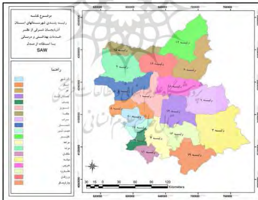
شکل (۴) رتبه بندی شهرستانهای استان آذربایجان شرقی از نظر میزان دسترسی به امکانات بهداشتی و درمانی با استفاده از مدل SAW