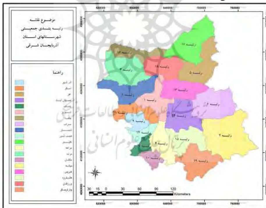
نقشه شماره (۲) رتبه بندی جمعیتی شهرستانهای استان آذربایجان شرقی