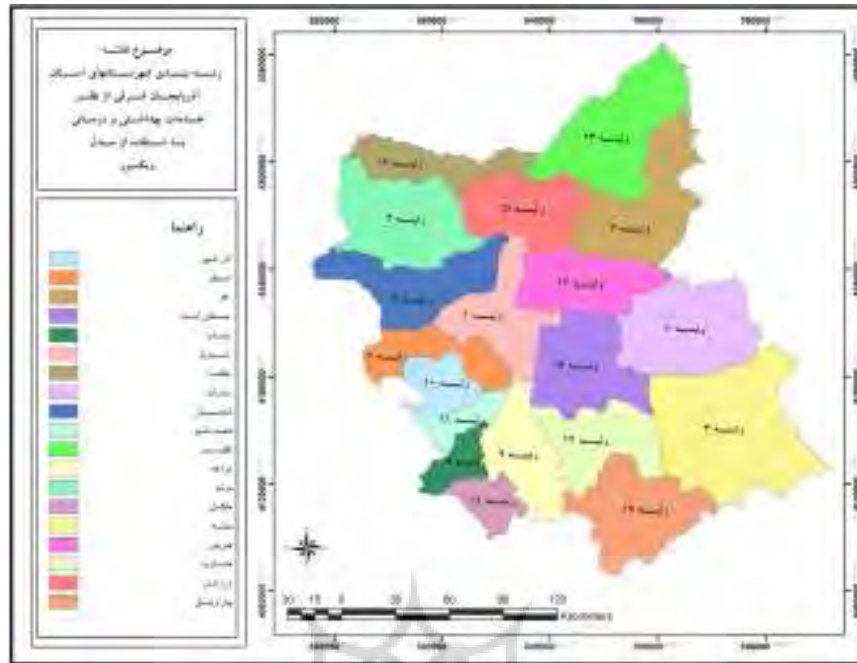
شکل (۳) رتبه بندی شهرستانهای استان آذربایجان شرقی از نظر میزان دسترسی به امکانات بهداشتی و درمانی با استفاده از مدل VIKOR