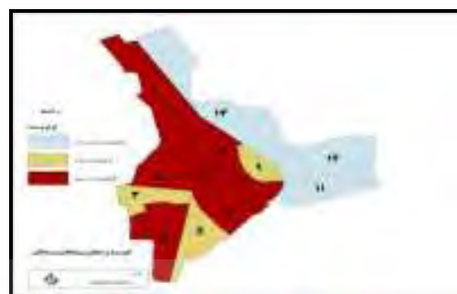
شکل ۶- نقشه اولویت‌های اجرایی و برنامه ریزی شهری محله محور در شهر بناب (بر اساس تکنیک سلسله مراتبی)