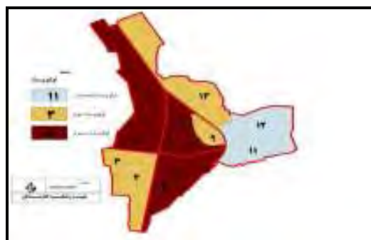
شکل ۵- نقشه اولیتهای اجرایی و برنامه ریزی شهری محلات شهر بناب بر اساس تکنیک توسعه یافتگی مورس

الف- دسته‌بندی و تشخیص محلات همگن بر حسب شاخصهای مورد مطالعه. ب- رویهم اندازی محلات مربوط به شاخصهای کالبدی، بر خورداری، اقتصادی و اجتماعی و تعیین سکونتگاههای توسعه یافته و توسعه نیافته. (در نقشه محلات شهر بناب و در محیط Arc GIS) ج- جمع‌بندی و روی هم اندازی محلات سکونتگاههای خودرو و شناسائی و تعیین قطعی آنها. (در نقشه محلات شهر بناب و در محیط Arc GIS). نتایج حاصل از محاسبات این تکنیک در تبیین محله بندی سطوح توسعه یافتگی محلات شهر بناب به شرح ذیل است: