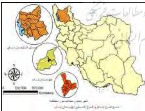
شکل ۱- نقشه موقعیت مکانی شهر بناب و محلات مورد مطالعه

سال ۱۳۳۵ اطلاعات دقیقی از تعداد سکنه شهر بناب در دست نیست ولی از ۱۳۵۵ تا سال ۱۳۸۵ (طی ۵۰ سال گذشته) جمعیت این شهر بیش از ۵ برابر شده است. آهنگ رشد جمعیت شهر بناب در سالهای ۱۳۴۵-۱۳۳۵ برابر ۸۶.۲ و در سالهای ۱۳۵۵-۱۳۴۵ برابر ۳۲.۴، بین سالهای ۱۳۶۵-۱۳۵۵ برابر ۶.۴، بین سالهای ۱۳۷۵-۱۳۶۵ برابر ۲۵.۳ و بین سالهای ۱۳۸۵-۱۳۷۵ برابر ۹۳.۱ درصد بوده است. طبق سرشماری آبان ماه ۱۳۸۵ تعداد ۷۶۵۸۶ نفر در شهر بناب زندگی می‌کنند. از این تعداد ۳۷۸۱۵ نفر (۴۹/۳۸ درصد) را جنس مرد و ۳۸۷۷۱ نفر (۵۰/۶۲ درصد) جنس زن تشکیل می‌دهد. (سرشماری عمومی نفوس و مسکن، سال ۱۳۸۵). از شاغلان ۱۰ ساله و بیش‌تر شهرستان (۲۷/۶۱) درصد در بخش کشاورزی، (۲۷/۵۸) درصد در بخش صنعت و (۳۸/۴۳) درصد در بخش خدمات به کار اشتغال داشته‌اند. این نسبت‌ها در شهر بناب به ترتیب (۸/۰۹)، (۳۳/۱۷) و (۵۴/۰۸) درصد بوده است. سلسله مراتب فضایی-مکانی شهر بناب و محلات مورد مطالعه در شکل ذیل نشان داده شده است.