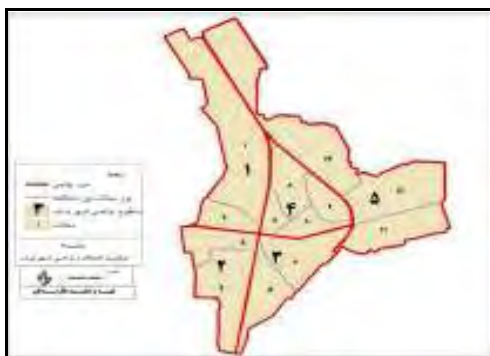
شکل ۳- نقشه تعیین حدود نواحی و محلات