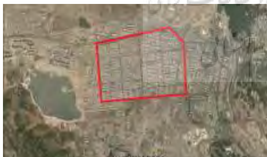
شکل ۲- موقعیت محدوده مورد مطالعه، ماخذ:

شهرک گلستان واقع در منطقه ۲۲ شهرداری تهران جنب شهرک امید واقع شده است. شهرک گلستان که دارای ساختمان‌هایی با تراکم کم و یا ویلایی است در شرق پارک چیتگر واقع گردیده است شهرک گلستان نام جدید شهرک "راه آهن" است و مهم‌ترین بلوارهای آن عبارت‌اند از بلوار کاج، هاشم زاده و گلها از مهم‌ترین میدان‌های آن می‌توان به میدان اتریش اشاره نمود که در بلوار گلها واقع است (www.fa.wikipedia.org).