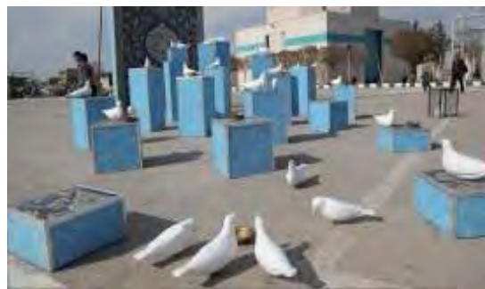
تصویر شماره ۳: المان آب و دون

و کبوتران حرم برایش زنده می‌شود و از این نظر به کارگیری این المان و مشابه آن در محیط شهر مشهد مثبت ارزیابی می‌شود.