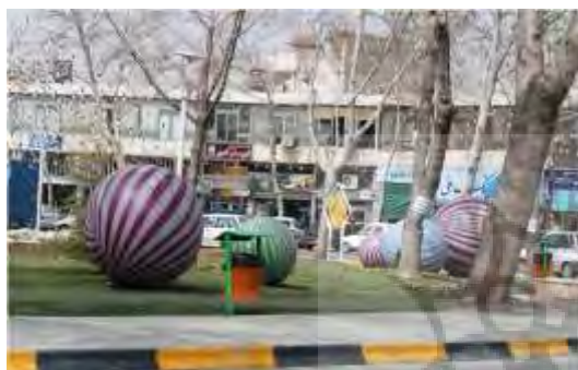
تصویر شماره ۴: المان بریم گل کوچیک

تحلیل نهایی المان: این المان اشاره خاصی به فرهنگ و هویت شهر اسلامی مشهد نمی‌کند و بیانگر بخشی از فرهنگ عمومی مردم است. از این جهت شکل-گیری تصویر ذهنی بر اساس این المان از شهر مشهد، به گونه‌ای که ناظر وقتی بدان نگاه می‌کند، یاد خاطرات گذشته او برایش زنده شود، و از این نظر به کارگیری این المان و مشابه آن در محیط شهری کم رفت و آمد مثبت ارزیابی می‌شود.