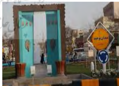
تصویر شماره ۹: المان موج و کشتی

تحلیل اولیه المان: این المان در مکان دروازه سابق مشهد به نام دروازه قوچان قرار گرفته است و از نقاط پر رفت و آمد زائرین به حساب می‌آید. پیام این المان به صورت غیر مستقیم اشاره به احترام زائران و مجاوران در ورود به حریم مقدسی حرم مطهر دارد و از این بابت اذن ورود و دخول طلبیده می‌شود و در این المان در به روی زائران گشوده شده است. تداعی این اثر، خاطره فردی است که به هنگام ورود به هر خانه، رد شدن از در و اجازه ورود خواستن می‌باشد. تحلیل نهایی المان: به کارگیری این المان در یکی از نقاط ورودی شهر و معنای ضمنی آن بسیار خوب و مثبت ارزیابی می‌شود با این حال به نظر می‌رسد رعایت دو مورد می‌توانست به بالندگی این اثر بیشتر بیافزاید. نخست منظره‌ای که پس از باز شدن در به چشم می‌خورد می‌توانست پیامی مستقیم و یا غیر مستقیم از وجود امام هشتم و بارگاه ایشان را به تصویر کشد و در قسمت دوم با گسترش فضاها (به طور مثال دیوار مانند) در هر دو سمت در ورودی، وقتی در باز باشد، دید بیشتری را به خود جذب می‌کند.