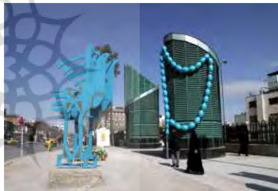
تصویر شماره ۸: المان پرنده نقارچی

تحلیل نهایی المان: نکته قابل توجه استفاده از این المان‌ها با مرجع تذکر اسلامی در یکی از پر رفت و آمدترین محل‌های تردد زائرین است که می‌تواند پیام خود را به زائرین بیشتری برساند با این وجود استفاده از یک تسمیح بزرگ مقیاس، به دور از ذوق هنری، ساده‌ترین شیوه انتقال پیام است که در آن ارزش‌های هنری یافت نمی‌شود، در واقع استفاده از المان‌هایی با پیام‌های مذهبی که فرد را تا حدودی به فکر فرو ببرد به نظر بهتر می‌باشد.