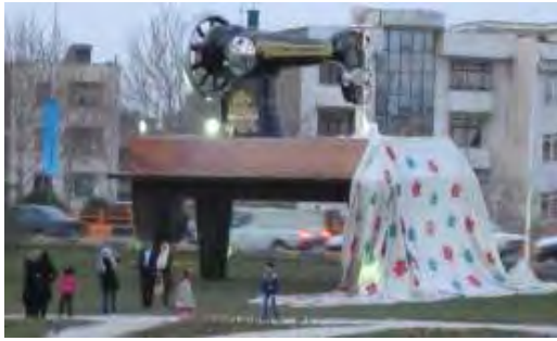
تصویر شماره ۱: المان یادگار مادر بزرگ