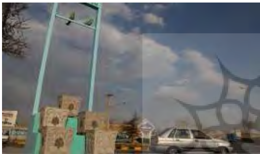
تصویر شماره ۷: المان پله‌ها

تصویر ذهنی بر اساس این المان از شهر مشهد، به گونه‌ای که ناظر وقتی بدان رجوع می‌کند، یاد سفر به محیط قدسی و آرامش بخش برای او تداعی می‌گردد و اینکه باعث تصور ذهنی مطلوب او از شهر می‌گردد، مفید و مثبت ارزیابی می‌شود ولی با توجه به اینکه در تقاطع کم رفت و آمد جانمایی شده، باید در تقاطع‌های پر رفت و آمد و در محل تردد زائران قرار بگیرد تا پیام مثبت خود را به طیف بیشتری از زائران و مجاوران ارائه نماید.