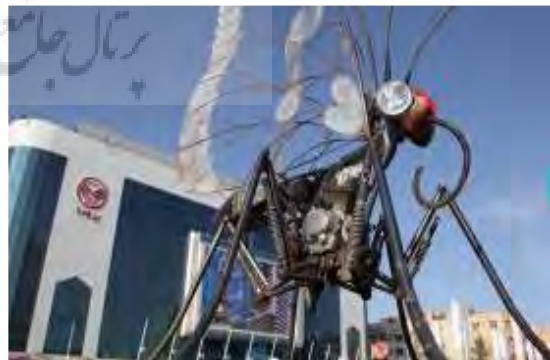
تصویر شماره ۵: المان تولدی دیگر

تحلیل نهایی المان: این المان اشاره خاصی به فرهنگ شهر اسلامی مشهد نمی‌کند مگر آن که فرافکنی کرده و معنای «تولد دیگری» را که دستاورد زیارت امام هشتم شیعیان می‌تواند باشد به این المان نسبت دهیم. با این حال برقراری این گونه ارتباط در ذهن ناظر به نظر دور می‌رسد. تصویر ذهنی بر اساس این المان از شهر مشهد، به گونه‌ای است که ناظر وقتی به یاد این المان بیفتد و یاد ترکیب نامانوس پروانه بعنوان یک موجود زنده و موتور سیکلت بعنوان مصنوع ساخت دست بشر برایش زنده شود، نه تنها برای او پیام و دستاوردی معنوی ندارد بلکه او را گاهی به تفکر درباره این ترکیب نامانوس وا می‌دارد و از این نظر به کارگیری این المان و مشابه آن در محیط شهری شهر مشهد منفی ارزیابی می‌شود.