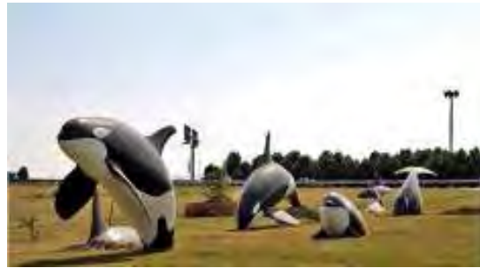
تصویر شماره ۶: المان کوچ نهنگ‌ها

است، بیشتر یاد شهرهای توریستی را به دنبال دارد تا شهری زیارتی.