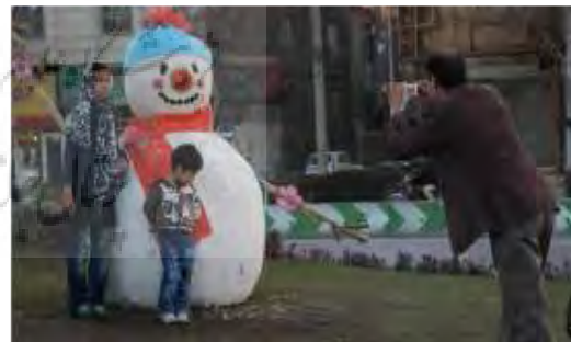
تصویر شماره ۲: المان سفر آدم برفی

اشاره می‌کند. ابعاد و اندازه آن در حد مقیاس انسانی است و درک المان از فاصله نزدیک میسر است. مکان قرارگیری المان در نقطه‌ای پر رفت و آمد بوده و در نتیجه پیام خود را به طیف گسترده‌ای ارائه می‌کند. تحلیل نهایی المان: با توجه به اینکه این المان در میدان راه‌آهن به عنوان یکی از مهمترین مبادی ورود زائرین حضرت علی بن موسی الرضا (ع) قرار گرفته بررسی و ارزیابی آن حائز اهمیت بسیار است، در واقع زائر در بدو ورود به جای اینکه پیامی با محوریت مذهب دریافت نماید به او پیام داده می‌شود که زمستان پایان پذیرفته است و در هنگام خروج از مشهد هم آخرین المانی است که مشاهده می‌کند که یکی از آخرین پیام‌هایی است که از شهر مشهد به سوغات می‌برد و این همان تهدیدی است که رفته رفته باعث تغییر تصور ذهنی او از شهر مشهد می‌گردد و از این نظر به کارگیری این المان و مشابه آن در محیط شهری شهر مشهد و به خصوص در این مکان منفی ارزیابی می‌شود.