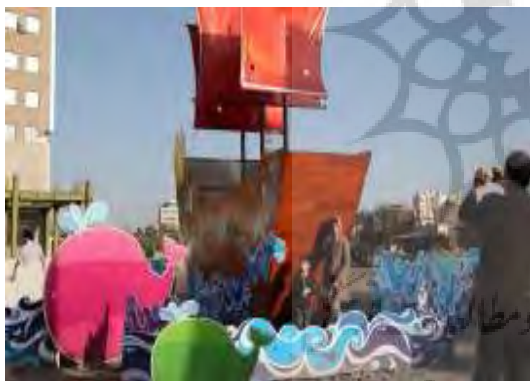
تصویر شماره ۹: المان موج و کشتی

تحلیل نهایی المان: قصد و هدف طراح و مدیر شهری از استفاده از این المان در یکی از تقاطع‌های پر رفت و آمد زائران و مجاوران به وضوح روشن نیست و در واقع هیچ‌گونه ارتباطی میان به کارگیری این المان با زمینه فرهنگی و مذهبی شهر مشهد برقرار نمی‌شود و از این نظر استفاده از این المان منفی ارزیابی می‌شود.