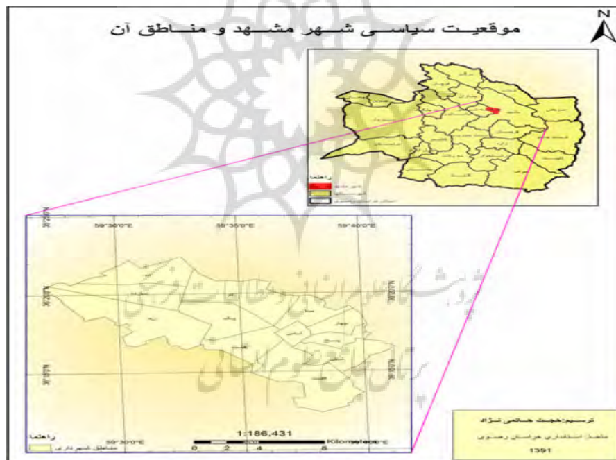
شکل ۱- نقشه موقعیت سیاسی - جغرافیایی شهر مشهد