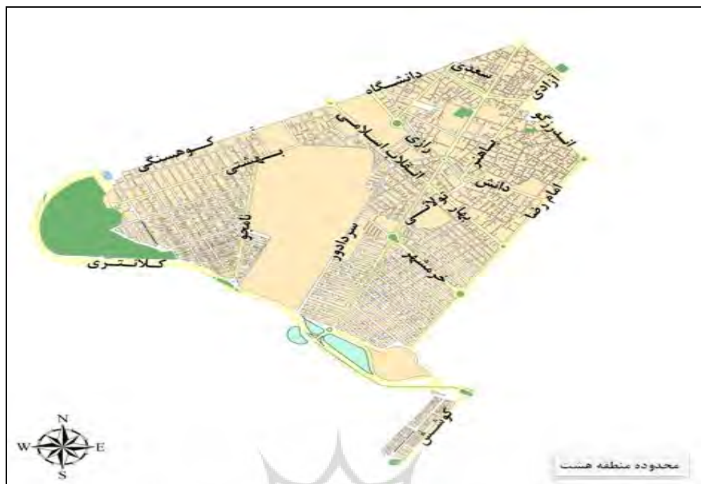
شکل ۱- نقشه موقعیت منطقه ۸ در کلانشهر مشهد