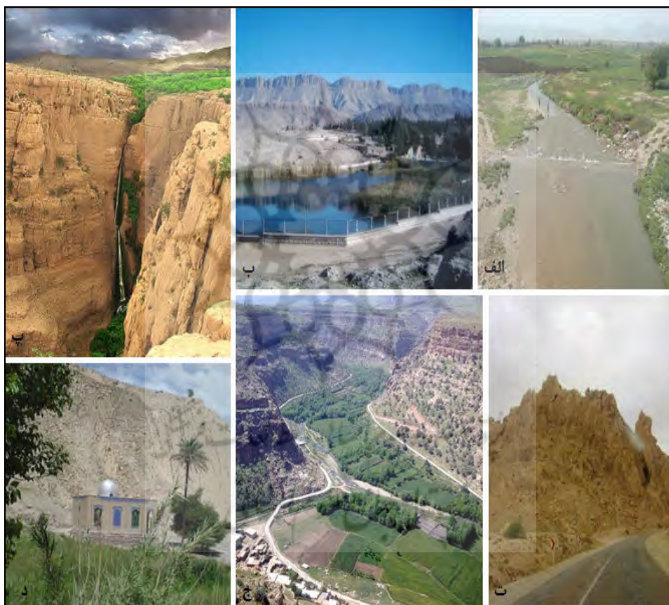
شکل ۲- لندفرم‌های مورد مطالعه: الف. رود الوند؛ ب. سراب گیلان غرب؛ پ. آبشار پیران؛

با دقت در تصاویر ماهواره‌ای، مشاهده نقشه‌های توپوگرافی و مشاهده‌های میدانی، ۶ لندفرم برجسته و دارای اهمیت برای گردشگری؛ یعنی، آبشار پیران، سراب گیلان غرب، چشمه امام حسن (ع)، دره گلین، تنگه حاجیان و رود الوند انتخاب شدند (شکل ۲). ویژگی‌های هر لندفرم در جداول (۶) تا (۱۱) آورده شده‌اند: