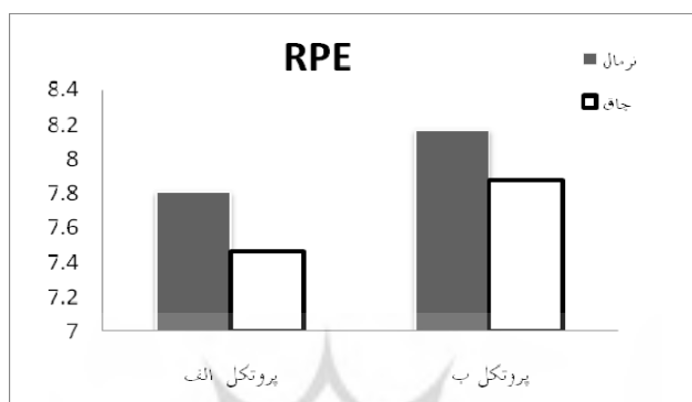
نمودار ۱. آزمون درک فشار

در نمودار ۱ ملاحظه می‌شود که میزان درک فشار (RPE) در هر دو گروه چاق و نرمال، به دنبال پروتکل ب (از عضلات کوچک به بزرگ) در مقایسه با پروتکل الف بیشتر بود ( p > 0.05 )، اگرچه اختلاف معنی‌دار درون‌گروهی و بین‌گروهی دیده نشد.