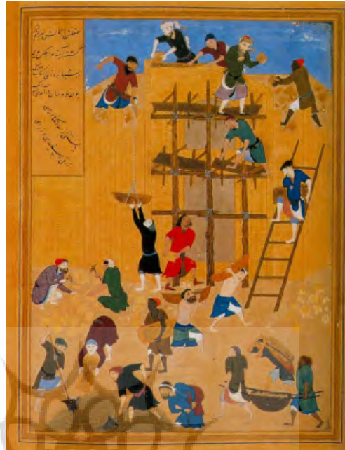
تصویر ۱: ساختن کاخ خورنق، کمال‌الدین بهزاد، خمسه نظامی، اواخر سده نهم هجری، موزه بریتانیا

از این دست نگاره‌ها بخشی اختصاصاً به عمل و ساخت معماری مربوط است؛ مثل نگاره‌هایی که در مرقد اصناف آمده است و اطلاعاتی در زمینه فهم معماری به مثابه پیشه به دست می‌دهد. این دسته از نگاره‌ها برای مطالعه موضوعاتی از قبیل چگونگی طرح‌اندازی یا تبدیل طرح به بنا، ابزار و مواد کار معماران یا استادکاران، گروه سازندگان و شناخت اجتماعی ایشان و موضوعاتی از این قبیل مناسب‌اند. این نگاره‌ها گرچه معدودند و کمتر مورد توجه قرار گرفته‌اند، مدرک بی‌نظیری برای چنین موضوعاتی است.