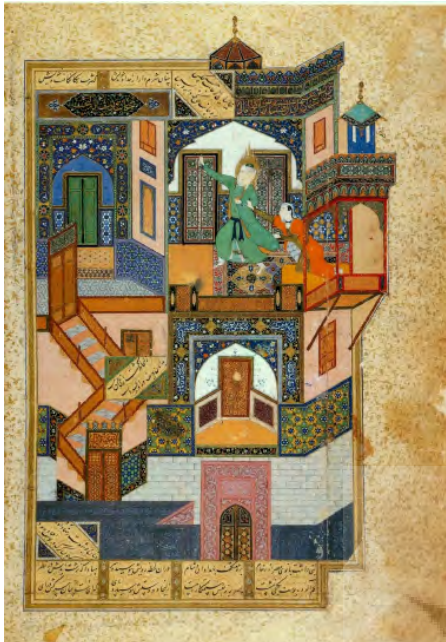
تصویر ۲: یوسف و زلیخا، کمال‌الدین بهزاد، بوستان سعدی، اواخر سده نهم هجری، کتابخانه سلطنتی قاهره