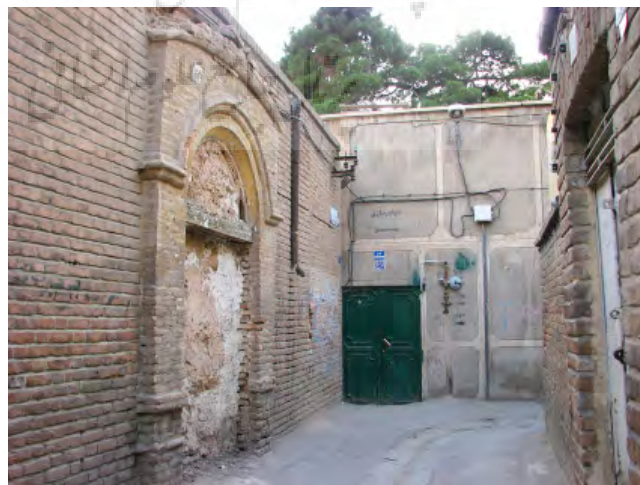
تصویر ۳: تخریب تزیینات بنا توسط مالک به‌منظور جلوگیری از ثبت (Rezaei 2014)