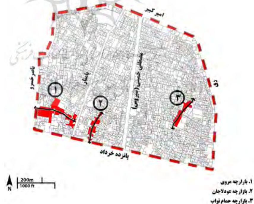
تصویر ۱: موقعیت قرارگیری بازارچه‌ها در محله عودلاجان

الف. بازارچه‌ها یا گذرها: در گذشته، معمولاً اصلی‌ترین معابر محله بوده‌اند و اغلب آن‌ها امروزه نیز جزء عناصر اصلی ساختار محله‌اند. بازارچه‌ها مراکز محلات را به یکدیگر مرتبط ساخته و بناهای مهم عمومی و خدماتی در امتداد آن‌ها قرار می‌گرفته است. در عودلاجان، چندین بازارچه و گذر وجود داشته که برخی از آن‌ها امروزه نیز باقی مانده‌اند. بازارچه عودلاجان که در بخش میانی محله امروزی قرار دارد، در امتداد بازار آهنگران (یکی از راسته‌های بازار تهران) شکل گرفته و در واقع گذری است که از بازار تهران به‌سوی شمال انشعاب یافته است (تکمیل همایون ۱۳۹۳). بازارچه دیگر، بازارچه حمام نواب در کوچه امامزاده یحیی است که در بخش شرقی عودلاجان واقع شده و اکنون نیز بخش عمده خدمات محله‌ای را در خود جای می‌دهد. این بازارچه عناصر تاریخی مهمی از جمله حمام نواب و مسجد معمارباشی را در کنار خود جای داده که حمام نواب در سال‌های اخیر پس از مرمت، به نمایشگاه و کارگاه صنایع دستی تبدیل شده است. بازارچه دیگر، بازارچه مروی است که در بخش غربی عودلاجان واقع شده است. این بازارچه که در سال‌های اخیر مرمت شده، مراکز خرید متعددی را در خود جای داده و غیر از کاربری تجاری، کاربری تفریحی و گذران اوقات فراغت نیز برای شهروندان دارد.