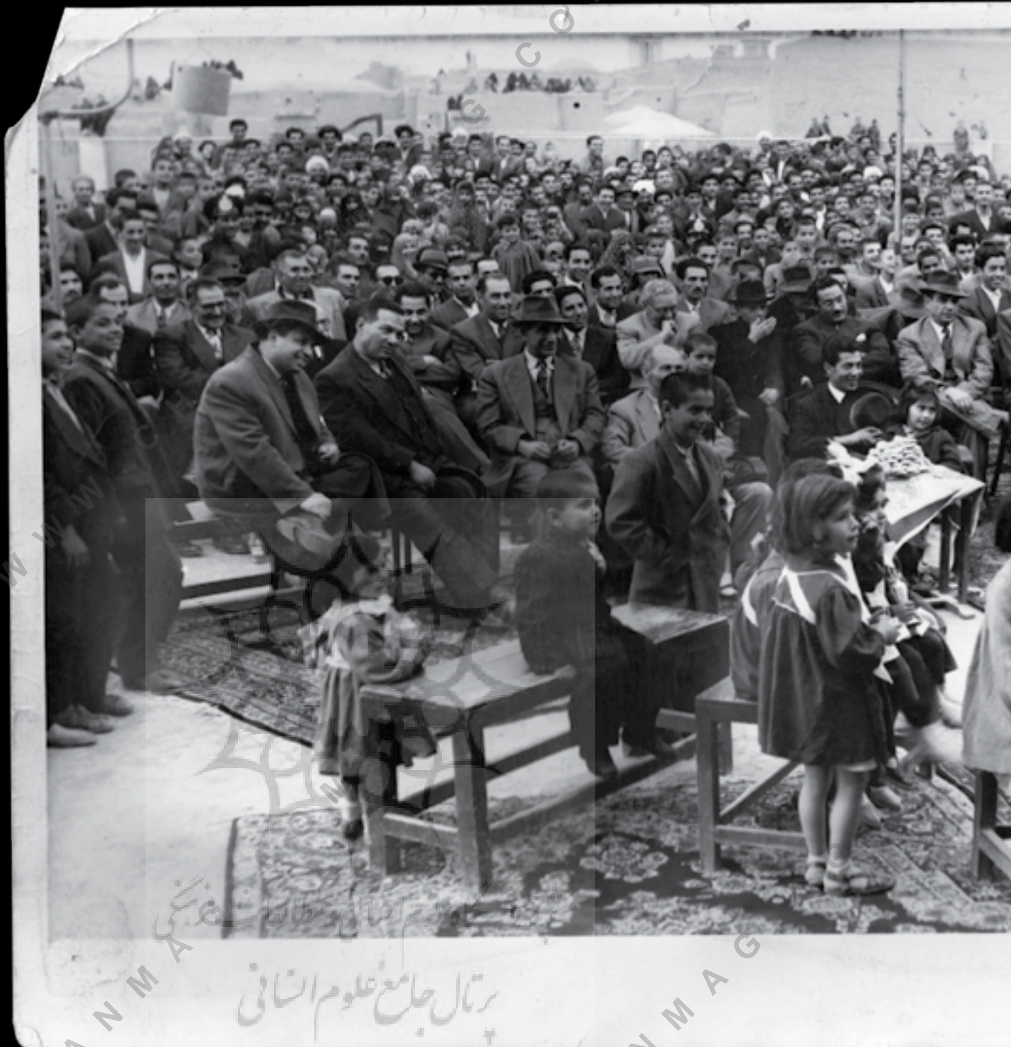
چهارم آبان در دبیرستان ایرانشهر در این مراسم جناب سرهنگ حشمتی رئیس شهربانی و آقای زارع فرماندار دیده می شوند؛ از مجموعه خصوصی جلال اشتری-یزد.