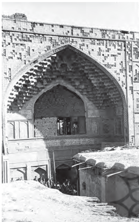
تصویر ۲. بخشی از نمای سردر مدرسه خان در دوره قاجار.

با توجه به شواهد تاریخی، طهماسب میرزا مؤیدالدوله در دو نوبت به حکمرانی فارس رسیده است. نخستین دوره حکومت او در فاصله میان ۱۲۶۹ تا ۱۲۷۵ ق بوده است و بر طبق گزارش میرزا حسن حسینی فسایی مرمت‌های مدرسه خان - پس از دومین زلزله ویرانگر فارس در ۱۲۶۹ ق - در اواخر این دوره صورت پذیرفته است. اما، با استناد به کتیبه‌های مربوط، تعمیرات مدرسه در این دوره میان سال‌های ۱۲۷۶ تا ۱۲۷۹ ق انجام شده و گفته فرصت‌الدوله در این باره صحیح‌تر است. این دوره مصادف با دومین نوبت حکومت مؤیدالدوله بر فارس بوده است و احتمالاً اشتباه صاحب فارسنامه ناصری هم از اختلاط نوبت‌های متوالی حکومت مؤیدالدوله بر فارس پیش آمده است. ۱ به هر صورت، کتیبه‌های تاریخ‌دار و موجود این سلسله از تعمیرات عبارت است از: