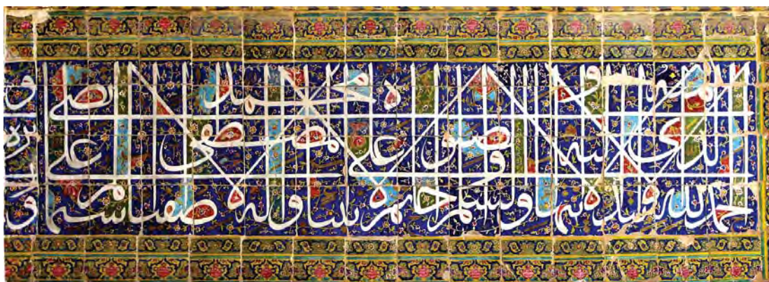
قسمت آغازین (جبهه جنوبی) کتیبه الوان سردر مدرسه خان. عکس از نگارنده، ۱۳۸۸.

پژوهشگاه علوم انسانی و مطالعات فرهنگی پرتال جامع علوم انسانی