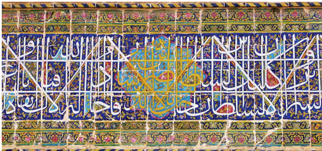
تصویر ۵. بخش میانی کتیبه سردر مدرسه خان. نام ناصرالدین شاه قاجار با رنگی متفاوت در درون شمسه متمایز شده است. عکس از نگارنده، ۱۳۸۸.

از کاشی نخست محدوده نوشتار کتیبه و حاشیه پایین با یک کاشی کامل تأمین شده است. عرض محدوده اصلی نوشتار نیز ۷۰ سانتی‌متر است. کتیبه سردر مدرسه خان سه‌بخشی است و مجموعاً ۱۸/۷۰ متر درازا دارد (بخش اول (جبهه جنوبی): ۳/۱۰ متر، بخش میانی (جبهه شرقی): ۱۲/۴۰ متر، بخش سوم (جبهه شمالی): ۳/۲۰ متر). محل نصب کتیبه نیز - با احتساب عرض کتیبه - ۷/۲۰ متر از کف ارتفاع دارد. سراسر زمینه کتیبه سردر مدرسه خان را بندی طوماری و پیچان با گل‌های ختایی ریز پوشانده است. گل‌ها سفید و قرمز نقاشی شده‌اند، اما برگ‌ها و ساقه‌ها زرد رنگ است. عبارت کتیبه با قلم ثلث سفید بر زمینه لاجورد و روی نقش پیاده شده است. اعراب و اعلام و نقطه‌گذاری‌ها نیز جملگی اخراپی‌رنگ است. دو کشیده معکوس سراسری کرسی‌های