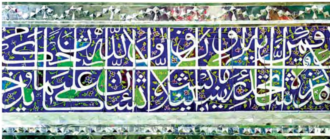
تصویر ۸. بخشی از کتیبه الوان امامزاده زید در بازار تهران. مأخذ: مکی‌نژاد، ۱۳۸۵: ۵۱.

این کتیبه هرچه باشد، چه پیش از کتیبه الوان سردر مدرسه خان و چه همزمان آن، می‌توان نکاتی را از مطابقت ظاهری این دو کتیبه تشخیص داد: اول اینکه خط و ترکیب کتیبه سردر مدرسه خان نسبت به کتیبه گنبدخانه امامزاده زید از استحکام و انسجام بیشتری برخوردار است؛ دوم اینکه تنوع و پراکندگی لکه‌های رنگی، دقت در رنگ‌گذاری، و انتخاب محدوده‌های رنگی در این کتیبه نسبت به دیگری بسیار سنجیده استفاده شده است. با این حساب، کتیبه سردر مدرسه خان نمونه شاخص‌تری از کتیبه‌نگاری الوان با تعاریف بالا خواهد بود. قطعاً معرفی دیگر نمونه‌های احتمالی از این نوع کتیبه‌نگاری می‌تواند دامنه تحقیقات در این باره را گسترش دهد. با این حال، به نظر نمی‌رسد این ابداع در دوران قاجار با استقبال چندانی مواجه شده باشد.