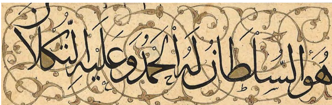
تصویر ۶. بخشی از صدر فرمان رستم بیگ آق قویونلو بر سندی درباره‌ی وگذاری بخشی از اراضی اصفهان، اراک و فیروزآباد به صورت اقطاع، با عبارت «هو السلطان له الحمد و علیه التکاء»: تاریخ سند ۹۰۲ق، ماخذ: سازمان اسناد و کتابخانه ملی (بخش اسناد).

کتیبه سردر مدرسه خان ۱۲۰ سانتی‌متر پهنا دارد و شامل نوار جوک‌کشی، حاشیه تزئینی و محدوده نوشتار است. جوک‌کشی با ضخامت تقریبی پنج سانتی‌متر و ترتیب متناوب آجرهای لعاب‌دار زرد و لاجورد، همراه با حاشیه‌ای تزئینی به ضلع ۲۰ سانتی‌متر هریک از طرفین بالا و پایین کتیبه را پوشانده است. حاشیه بالا با یک نیم‌کاشی و رنگ آمیزی نیمی