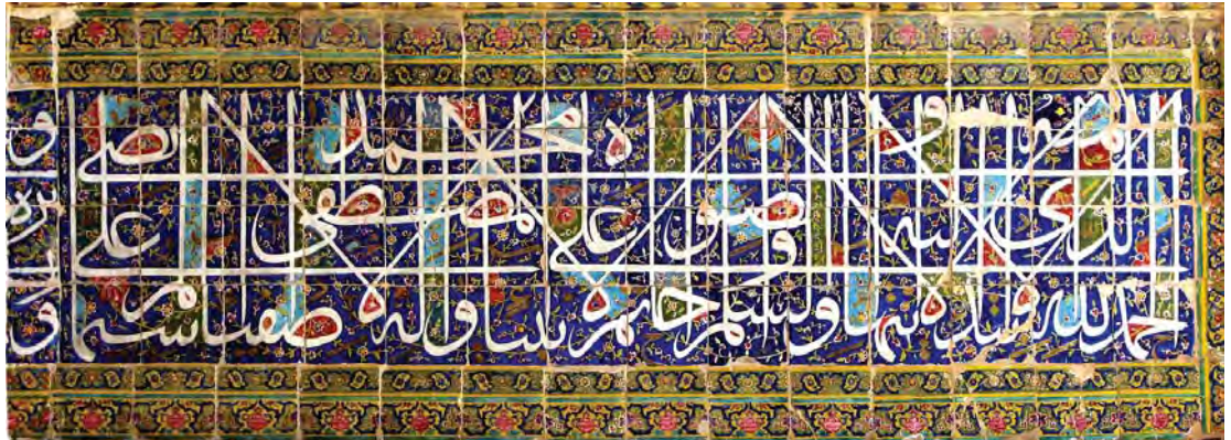
تصویر ۷. قسمت آغازین (جبهه جنوبی) کتیبه الوان سردر مدرسه خان. عکس از نگارنده، ۱۳۸۸.

کاشی هفت‌رنگ نیز تاندازه‌های منظور شده است. این قاعده تنوع و جزئیات بسیاری دارد که از جمله آنها پرکردن فضای بسته چشمه برخی حروف مانند «ص» با رنگی متمایز از رنگ زمینه کتیبه بوده است. این نکته لااقل از دوران تیموری در برخی کتیبه‌های کاشی معرق اعمال شده است و ظاهراً اقتباسی از شیوه کتاب‌آرایی در نسخه‌های خطی، خصوصاً مصاحف، بوده است (تصویر ۶). مطابق نمونه‌های موجود پوشش چشمه حروف در این کتیبه‌ها صرفاً به یک رنگ محدود شده است، اما در نمونه‌های مشابه با شیوه هفت‌رنگ ممکن است این فواصل در یک کتیبه با دو یا سه رنگ متنوع پوشیده شده باشد. این موضوع عموماً در کتیبه‌نگاری دوران قاجار قابل مشاهده است.