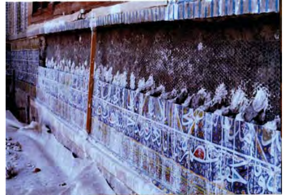
تصویر ۴. برداشتن قسمتی از کاشی‌های کتیبه سردر مدرسه خان در سال ۱۳۶۷ و نصب مجدد آنها پس از جازنی و زیرسازی با استفاده از تورفلزی و سیمان زبره.

بوده است. این گزارش و مشاهدات عینی نشان می‌دهد که کسری کاشی‌ها نیز بیشتر از ردیف کاشی حاشیه در طرفین کتیبه بوده است. از این نظر در بافت کلی و رنگارنگ محدوده نوشتار و خصوصاً متن کتیبه - جز در بازسازی و بازنویسی چند کاشی مختصر - اقدام مرمتی چندانی صورت نپذیرفته و اصل مرمت‌ها به برداشتن کاشی‌ها و مقاوم‌سازی سطح زیرین آن معطوف شده است.