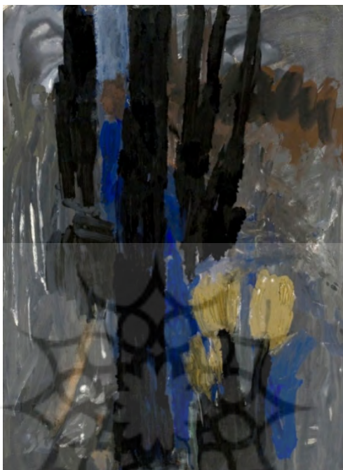
تصویر ۱. بی‌عنوان، گواش روی مقوا، ۵۰×۷۰ (سلطان کاشفی، ۱۳۸۶: ۵۹).

ذهن مخاطبانش را از آشفتگی و کثرت‌های فریبنده به وحدت و بساطت سوق دهد، آن‌ها را به درنگی شهودآمیز برساند.