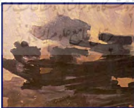
تصویر ۲. بی‌عنوان، گواش روی مقوا، ۵۰×۷۰ (همان: ۷۴).

و مبدا ترس آشفته شود که آیشخور جان‌دار من است/ و مبدا غم فرو ریزد که بلندآسمانهٔ زیبای من است (سپهری، ۱۳۸۵: ۱۹۵).