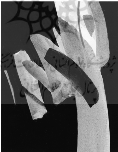
تصویر ۶. بی‌عنوان، آب مرکب روی کاغذ، ۱۹×۱۵ (همان: ۸۷).

در این شعر دال‌های درخت، باغ، کوچه، کودک، کاج، لانه نور، و خانه دوست همگی مفاهیمی عرفانی دارند که با بیانی سمبلیک بازگو شده‌اند؛ زیرا شاعر حامل تجربه‌ای شهودی بوده است که جز از این راه امکان بازگویی آن را نداشته است. میل سهراب به معانی رمزی و گرایش او به سمبلیسم، تابعی قهری از زیبایی‌شناسی شهودی اوست؛ زیرا در زیبایی‌شناسی شهودی، مشهودات بی‌تعینی و سیالیتی دارند که جز با ابهام و بیانی رمزآلود از آنها نمی‌توان تعبیری به دست داد. کروچه بر آن است که «شهود عبارت است از ادراک به وسیله رمز و علامت؛ زیرا جایی که رمز نمودار معنی است معنی قائم به خود نیست؛ یعنی جداگانه و بی‌وساطت رمز به اندیشه در نمی‌آید» (کروچه، ۱۳۸۸: ۷۹). حتی عده‌ای بر آن‌اند که بنیاد هرگونه هنری بر بیان سمبلیک استوار است. هگل می‌گوید: «هنر ظهور حسی مثال یا حقیقت (روح) است. هنر در پی عینیت بخشیدن به حقایق کشف‌ناشده (= ناشناخته) است. هگل چنین می‌اندیشد که نخستین شکل هنر سمبلیک بودن است» (الیاده، ۱۳۷۴: ۲۶۱).