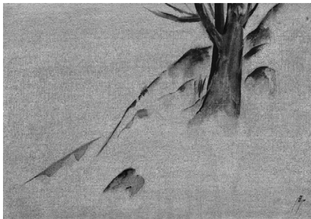
تصویر ۴. بی‌عنوان، آب‌مرکب روی کاغذ، ۶۸×۴۸ (حسینی، ۱۳۹۰: ۱۲۲).

در شعر مذکور، با توجه به محور هم‌نشینی، «پشت هیچستان» نشانه یا دالی است که بر مکانی فراواقعی و برساخته ذهن و خیال شاعرانه سهراب دلالت دارد. شعیری در مقاله‌ای درباره پشت هیچستان می‌نویسد: «پشت هیچستان مکانی است فاصله‌گرفته از هیچستان که در فراسوی آن قرار گرفته و آن را پشت سر نهاده است؛ گویا انفصال و وصال در کار بوده است. این تحول از یک سو انفصال با هیچستان و از یک سو وصال با پشت هیچستان و ایجادکننده حالت تازه است. گرمس (۱۹۱۷-۱۹۹۱)، معناشناس بزرگ فرانسوی، چنین حالتی را «فعالیت زیباسازی» می‌نامد. او معتقد است چنین حالتی که خود نتیجه یک جریان ادراکی مشاهده‌ای است، در واقع، عملیات تجربی پراحساسی است که فاعل را در شیء ارزشی مورد نظر ذوب می‌کند» (شعیری، ۱۳۷۹: ۵۴). نشانه‌های دیگری چون «گل واشده» دورترین «بوته خاک» به اصلی ازلی و نخستینه اشاره دارد و او را به یاد روزهایی که از اصل حقیقتش جدا شده می‌اندازد و روحش را به آن نزدیک‌تر می‌کند. هر چه انسان به اصل و مبدأ آفرینش نزدیک‌تر می‌شود بی‌تابی و شور و اشتیاق بیش‌تری را در پیوستن به حقیقت ازلی احساس می‌کند که این خود دربردارنده لذت و احساسی خوشایند است؛ زیرا روح هنگام کشف و شهود عارفانه، زیبایی را از سنخ همان فضاها و تجربه‌ها می‌یابد و تلاش می‌کند زیبایی را با زبانی شاعرانه تداعی و خاطره‌ای ازلی را بازسازی کند.