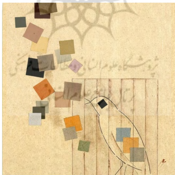
تصویر ۵. بی‌عنوان، کلاژ روی مقوا و طراحی، ۵۰×۵۰ (همان: ۸۳).

می‌شوند و عمل می‌یابند و بدین ترتیب، انسان نگرش بسیاری ژرف به واقعیت محسوس پیدا می‌کند (سوانه، ۱۳۸۸: ۶۲). سپهری با آفرینش هنرمندانه یک تابلو، ضمن آن‌که با عناصر عینی و موجود در تابلو به القای مفاهیم و احساسات مورد نظر خود می‌پردازد، در پس‌زمینه اثر نیز با غیاب و حذف (عناصر ناموجود) بر عمق اثر هنری خود می‌افزاید. در تصویر ۵ می‌بینیم که حدود نیم یا گاهی بیش از نیمی از تابلو را فضایی تهی در بر گرفته است که به نظر نمی‌رسد از سر ناچاری یا بی‌توجهی بوده باشد؛ زیرا سهراب نقاشی چیره‌دست و فن‌آشناست که در فضاهای خالی‌اش نیز حرف برای گفتن دارد. «در فضای آثار سپهری، لحظه‌ای طبیعت آشکار می‌شود، ولی هنوز آن واحه به‌درستی جذب مخاطب نشده، که در فضایی خلوت، که سکوت بر آن حاکم است به تجربه فضایی انتزاعی نائل می‌گردد که برآمده از اندیشه و روح عارفانه خالق آن است» (حسینی، ۱۳۹۰: ۲۹). از این رو، فضاهای خالی نقاشی سهراب را باید عنصری بیانی به حساب آورد که پاره‌ای از تجربه شهودی او را بازتاب می‌دهد و همین تنهایی و خلوت و سکوت است که روح سهراب را با خلسه‌ای سکرآور پیوند می‌زند. او به مدد تجربه «تنهایی» تصاویری خلق کرده است که به سبب ابهامی گوهرین، که بر بیش‌تر آن‌ها سایه افکننده، واجد ارزش هنری و شایسته تأمل‌اند.