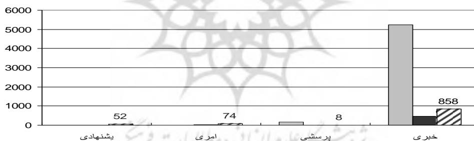
شکل ۱: نمودار فراوانی انواع بند وجهی شده (پیشنهادی، امری، خبری، پرسشی)

۴- اغلب پرسش‌ها در پی جواب نیست و تأیید مخاطب را می‌طلبد که این نوع را می‌توان صورت نشان‌دار نوع خبری در نظر گرفت که با توجه به این موضوع بر درجه‌ی تأکید خبرها افزوده است. به علاوه، او از ساخت افعالی استفاده می‌کند که معنای تأکید را در خود دارند (همی+...).