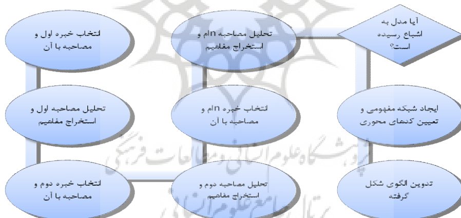
نمودار ۱- فرآیند گردآوری و تجزیه و تحلیل داده‌های کیفی (نتایج حاصله از مصاحبه با خبرگان)

به منظور تجزیه و تحلیل داده‌های کیفی این پژوهش (نتایج حاصل از مصاحبه با خبرگان)، از روش کدگذاری تئوریک استفاده شده است. کدگذاری به فرآیندی از تحلیل اشاره دارد که از خلال آن مفاهیم تشخیص داده شده، ابعاد و خصوصیات آن در داده‌ها کشف می‌گردند. پروسه تحلیل داده‌های بدست آمده از مصاحبه با خبرگان در دو مرحله صورت گرفته است. این مراحل به ترتیب، کدگذاری باز و کدگذاری محوری هستند که در جدول (۴) آورده شده‌اند. کدگذاری باز به آن بخش از کار اطلاق می‌شود که به طبقه بندی کردن پدیده‌ها از یادداشت‌های کوتاه پرداخته می‌شود که نتیجه‌ی نهایی آن، نام نهادن و طبقه بندی کردن مفاهیم است. پس از این مرحله مفاهیم بدست آمده از کدگذاری باز به هم مربوط می‌شوند. این مرحله را کدگذاری محوری می‌نامند. فرآیند گردآوری و تجزیه و تحلیل داده‌های کیفی (نتایج حاصله از مصاحبه با خبرگان) در نمودار (۱) آورده شده است.