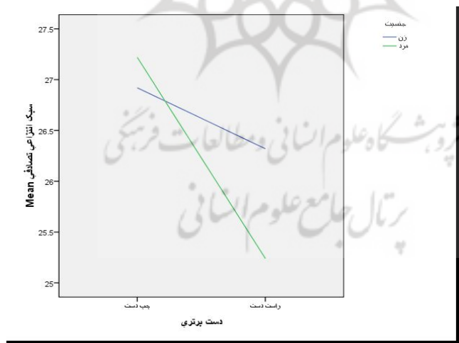
نمودار 3. تعامل جنسیت و دست برتری در سبک انتزاعی تصادفی.

نمودار 2 نشان می‌دهد که سبک انتزاعی - متوالی در بین دانشجویان راست‌دست چه دختر و چه پسر بیشتر از دانشجویان چپ‌دست می‌باشد.