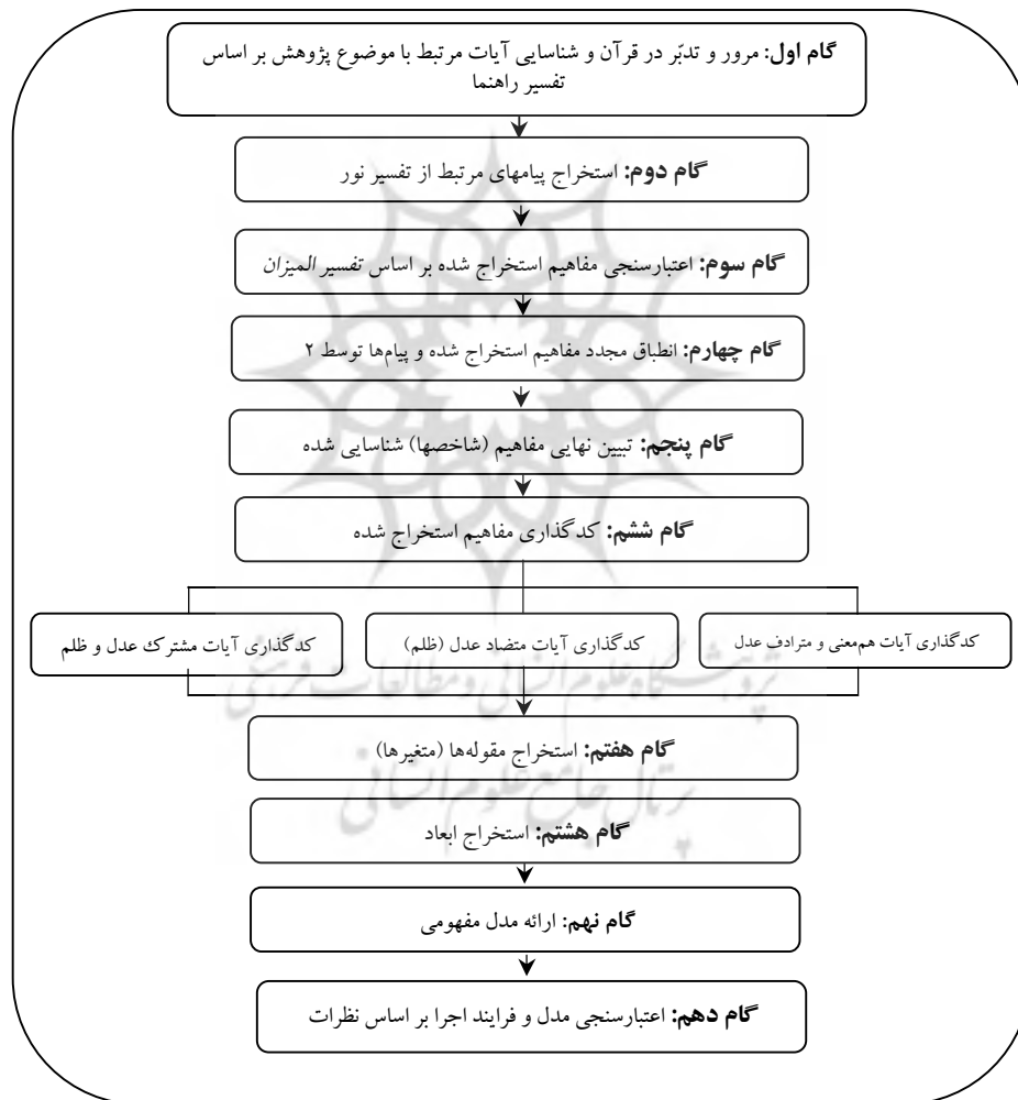
شکل ۲. گامهای ده گانه اجرای پژوهش