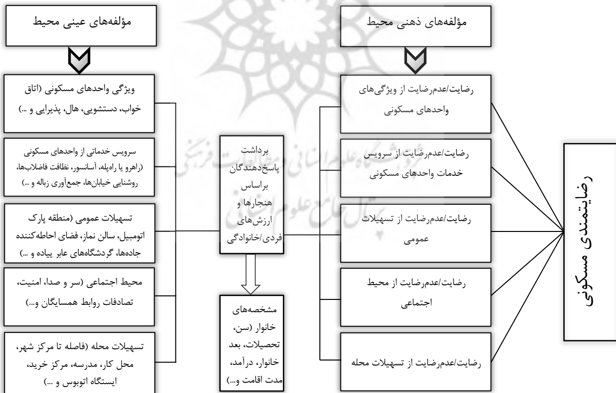
شکل 1- مدل تأثیرگذاری مؤلفه‌های عینی و ذهنی بر روی رضایتمندی از محیط مسکونی

در مطالعات مختلف، رضایتمندی محیط‌های مسکونی و ویژگی‌های عینی و ذهنی تنوعات