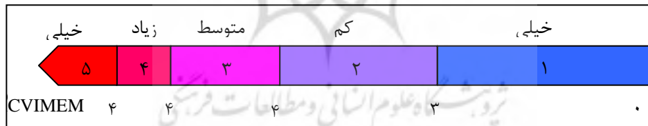
شکل (۳) طیف آسیب پذیری اقلیمی

در این رابطه، CVIMEM : شاخص آسیب پذیری اقلیمی مبتنی بر مدل ضربی-نمایی؛ EX : نمره‌ی مواجهه؛ CS : نمره‌ی حساسیت اقلیمی و AC : نمره‌ی ظرفیت سازگاری است که در واقع بیانگر کمبود ظرفیتها برای سازگاری با تغییر (پذیری) اقلیم است که سبب افزایش آسیب پذیری می‌شود.