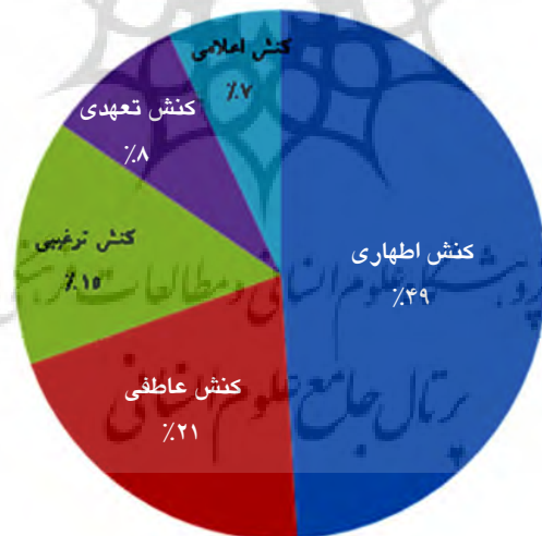
نمودار ۱ فراوانی انواع کنش‌های گفتاری در سوره‌های مکی