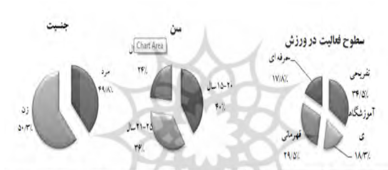
شکل ۴: نمودار دایره‌ای متغیر وضعیت سطوح مشارکت. شکل ۳: نمودار دایره‌ای متغیر سن در نمونه. شکل ۲: نمودار دایره‌ای متغیر جنسیت در نمونه.

نتایج نمودارهای ۲، ۳ و ۴ نشان می‌دهند که در این پژوهش، توزیع پاسخگویان برحسب جنس تقریباً برابر بوده است (حدود ۴۹٪ مرد و ۵۱٪ زن). بیشترین فراوانی پاسخگویان (حدود ۴۰٪) در گروه سنی ۱۵-۲۰ سال بود و به‌طور کلی، حدود ۷۶٪ از پاسخگویان بین ۱۵ تا ۲۵ سال سن داشتند. همچنین بیشترین فراوانی نمونه‌های پژوهش حاضر (حدود ۳۵٪) متعلق به گروهی بوده است که در سطح تفریحی و همگانی به فعالیت در ورزش می‌پرداختند و کمترین فراوانی افراد (حدود ۱۸٪) مربوط به گروهی بود که اعلام کرده بودند در سطوح حرفه‌ای در ورزش مشارکت دارند.