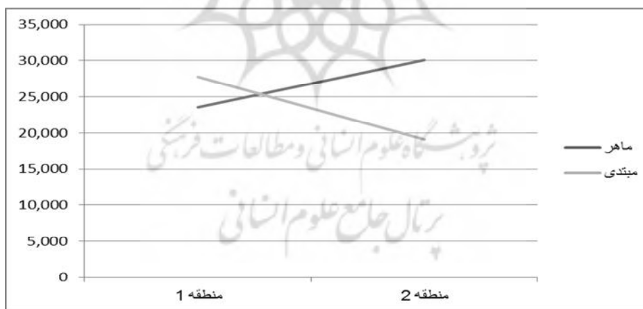
شکل ۲- میانگین مدت‌زمان دیدن مناطق مختلف نمایش

با توجه به نمودار بالا، نتایج حاصله نشان می‌دهد که میانگین مدت‌زمان دیدن در منطقه ۱ در افراد ماهر نسبت به افراد مبتدی پایین‌تر است و از سوی دیگر، میانگین مدت‌زمان دیدن در منطقه ۲ در افراد ماهر بیشتر از افراد مبتدی است. اما در ادامه، نتایج حاصل از آزمون تحلیل واریانس عاملی مرکب نشان داد که اثر اصلی مناطق نمایش معنادار نیست ( F_{(1,26)}=3.46, P=0.062 ). اثر اصلی گروه‌های آزمایشی نیز معنادار نیست ( F_{(1,26)}=1.54, P=0.22 ). اما اثر تعاملی گروه‌های آزمایشی و مناطق مختلف نمایش معنادار است ( F_{(1,26)}=4.65, P=0.032 ). به این مفهوم که بین مدت‌زمان نگاه کردن افراد مبتدی و ماهر در سه منطقه مورد نظر، تفاوت معناداری وجود دارد. اما در ادامه، نتایج حاصل از آزمون تی مستقل نشان می‌دهد که مدت‌زمان نگاه کردن به منطقه ۱ ( t=5.43, P=0.001 ) و ۲ ( t=4.58, P=0.001 ) در دو گروه به‌طور معناداری متفاوت بود. اما در منطقه ۳ در دو گروه تفاوت معناداری ( t=1.13, P=0.26 ) یافت نشد. با توجه به نتایج حاصل از آمار توصیفی، گروه ماهر نسبت به گروه مبتدی مدت‌زمان بیشتری را صرف نگاه کردن به منطقه ۱ کرده‌اند و در مقابل گروه مبتدی نسبت به گروه ماهر مدت‌زمان بیشتری را صرف نگاه کردن به منطقه ۲ کرده‌بودند. مدت‌زمان دیدن (ثانیه) در مناطق مختلف (منطقه ۱. از ناحیه سر تا ناحیه کمر، منطقه ۲. از ناحیه کمر تا انتهای پاها و منطقه ۳. ناحیه توپ) در موقعیت ۳ در مقابل ۳ در شکل ۲ نشان داده شده است.