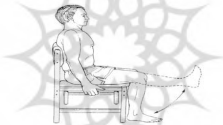
شکل ۶. باز کردن زانو در حالت نشسته

- بیمار در وضعیت نشسته روی صندلی، ابتدا حرکت اکستنشن زانو را (تا حداکثر دامنه ممکن) اجرا می کند و بعد از ۵ ثانیه مکث به آرامی به وضعیت اول برمی گردد (شکل ۶). این تمرین به وسیله هر پا سه سری و در هر سری ۱۵-۱۰ مرتبه اجرا می شود.