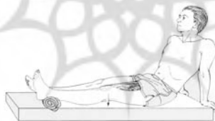
شکل ۳. پرس زانو

- در وضعیت نشسته با پای کشیده و درحالی که پتویی در زیر پاشنه پا لوله شده است، زانو به طرف پایین فشرده می‌شود: «۵ ثانیه مکث، ۵ ثانیه آرمیدگی» (شکل ۳). این تمرین به وسیله هر پا سه سری و در هر سری ۱۵-۱۰ مرتبه اجرا می‌شود.