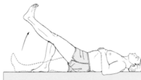
شکل ۴. بلند کردن پای کشیده

- در وضعیت طاقباز، زانوی یک پا خم است و کف پا روی زمین قرار می‌گیرد. پای دیگر (در وضعیت کشیده) به آرامی به بالا و پایین کشیده می‌شود (شکل ۴). این تمرین به وسیله هر پا سه سری و در هر سری ۵-۳ مرتبه اجرا می‌شود.