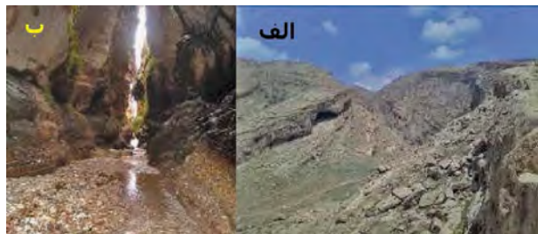
نگاره ۳: نمونه هایی از غارهای استان الف) غار شمال باختری شهر ایوان غرب، ب) غار زینه گان

گرمای طاقت فرسای بیرون غار، در حین گذر از دورن غار ریزش قطرات آب به شکل باران منظره بسیار دیدنی و نادری را به ارمان می آورد و شاید به همین دلیل باشد که به آن «غار بهشت» نیز می گویند. این غار همه ساله بویژه در فصل تابستان گردشگران زیادی را به خود جذب می نماید.