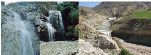
نگاره ۵: سمت چپ: آبشار سرتاف، وسط: آبشار چم آو، سمت راست: آبشارهای هفتگانه روستای آبشاران

با توجه به ساختمان زمین‌شناسی و لیتولوژی استان، در مسیر رودخانه آبشارهای متعدد و زیبایی تشکیل شده‌اند که یکی از زیباترین جاذبه‌های گردشگری استان به شمار می‌آیند. با توجه به سهولت دسترسی به آبشارهای استان که معمولاً در اطراف مناطق روستایی قرار گرفته‌اند می‌توان گفت تقریباً در بیشتر ایام سال (فصول بهار، تابستان و حتی پاییز) گردشگران زیادی از آنها بازدید می‌نمایند. برخی از این آبشارها که عبارتند از: آبشار گچان، سرتاف، چم آو (ایلام)، آبشار برتاف دهلران، آبشار ماهوته، دربند و آبشارهای هفتگانه روستای آبشاران (خریزان) در نوع خود بی نظیر هستند (نگاره ۵).