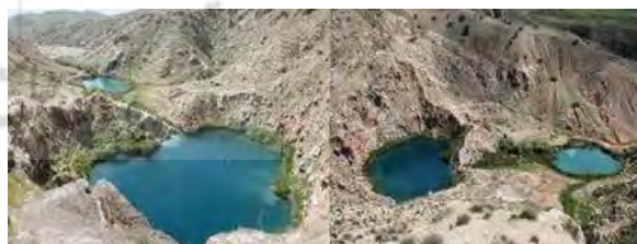
نگاره ۶: دریاچه‌های دوقلوی سیاگاو

عموماً دریاچه‌ها و تالاب‌های طبیعی از مناظر و جاذبه‌های ژئوتوریستی - ژئومورفولوژیکی مهم هر منطقه محسوب می‌شوند. در سطح استان دریاچه‌ها و تالاب‌های طبیعی معدودی تشکیل شده است. ولی همین تعداد اندک باعث جذب گردشگران قابل توجهی در این مناطق شده است. مهمترین، نادرترین و تپیک‌ترین این دریاچه‌ها، دریاچه‌های دوقلوی سیاگاو در ۸ کیلومتری سراب آبدانان می‌باشد (نگاره ۶). این دریاچه‌های دوقلو در سطح دشت منطقه تشکیل شده و رشته کوه‌ها، اطراف آن را فرا گرفته‌اند. با توجه به لیتولوژی منطقه، احتمالاً این دریاچه‌ها از نوع دولین‌های آبدار باشند. این دو دریاچه از طریق کانال باریکی به درازای تقریباً ۷۰ متر به یکدیگر متصل می‌شوند. دریاچه بالایی که سرچشمه این دریاچه نیز می‌باشد وسعت بیشتری دارد و آب آن نیز از کیفیت مناسبی برخوردار است، ولی متأسفانه دریاچه پایینی از آلودگی‌های انسانی در امان نمانده است. به طور کلی این دریاچه‌ها می‌توانند به عنوان یکی از مهمترین جاذبه‌های ژئوتوریستی آبی استان مورد استفاده قرار گیرند. علاوه بر دریاچه‌های دوقلو، تالاب‌های زمزم، چکر و ... نیز از جاذبه‌های ژئوتوریستی استان می‌باشند که عمدتاً در اطراف شهر ایلام قرار دارند.