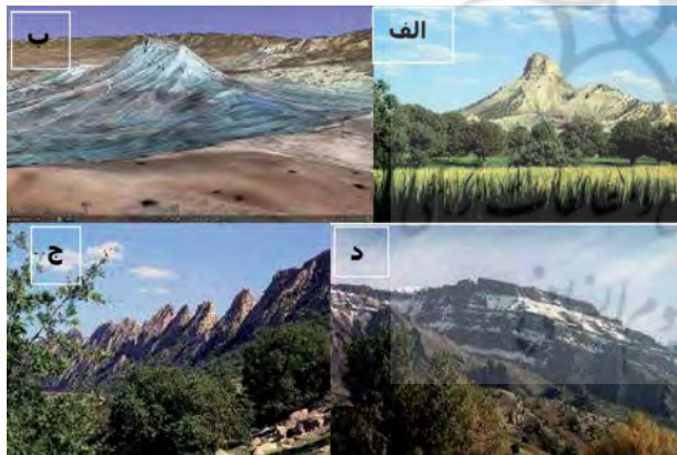
نگاره ۲: الف) دورنمایی از کوه قلاقران از منطقه ششدار، ب) تصویر ماهواره‌ای کوه قلاقران، ج) کوه شش کلان، د) کبیرکوه

کبیرکوه به عنوان بلندترین قله استان با فرازای حدود ۲۸۰۰ متر و نیز لغزش بزرگ آن می‌تواند در جذب ژئوتوریست‌های خارجی و داخلی جهت بازدید از این رویداد تاریخی مؤثر باشد. همچنین کوه مانشت با فرازای حدود ۲۶۴۰ متر (صفاری و منصوری، ۱۳۹۲) که در بین شهرستان‌های ایلام و ایوان واقع شده و در بیشتر ایام سال پوشیده از برف می‌باشد یکی از مناطق زیبا جهت بازدید گردشگران طبیعت دوست می‌باشد. همچنین غار طلسم ایوان در دامنه‌های این کوه قرار گرفته است.