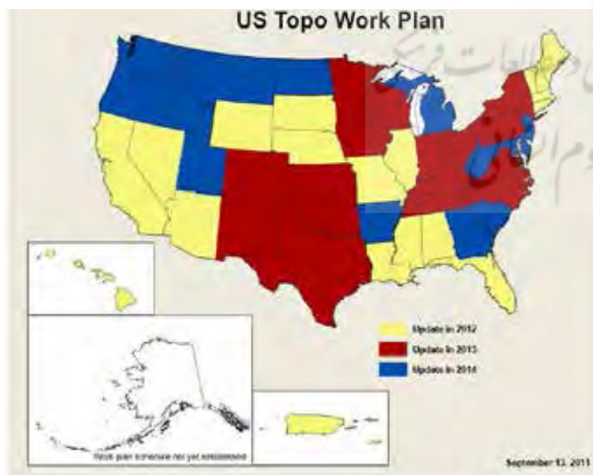
نگاره ۱: نحوه تکمیل نقشه‌های US Topo در طی یک بازه سه‌ساله [۳]

نقشه‌های US Topo در قالب خروجی گرافیکی با عنوان GeoPDF با همان هشت لایه اطلاعاتی می‌باشد. لایه تصویر اورتو بر مبنای عکس از برنامه تصویربرداری کشاورزی ملی (۱۱) ، لایه حمل و نقل از وزارت داخلی و اتوبان‌های آمریکا از دفتر سرشماری، لایه نام‌های جغرافیایی از سیستم اطلاعاتی نام‌های جغرافیایی اخذ شده است. از اکتبر ۲۰۰۹، منحنی میزان‌ها و هیدروگرافی به نقشه جدید اضافه شد. سایر لایه‌های نقشه ملی در سال ۲۰۱۱ به آن اضافه شده است. این نقشه‌ها هر سه سال یک مرتبه توسط USGS تولید می‌گردند. در نگاره ۱ زمان‌بندی تولید و به‌روزرسانی نقشه‌های US Topo نشان داده شده است.