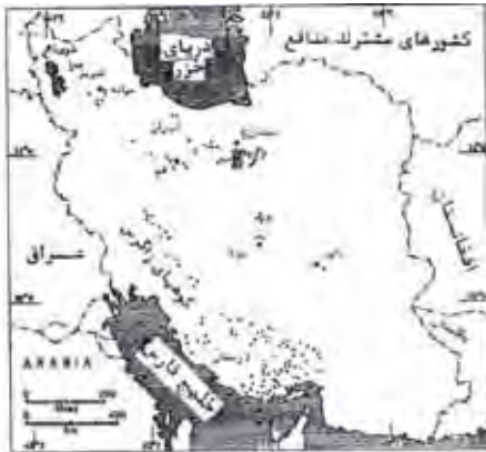
نقشه ۱ _ نقشه پراکنندگی گنبد‌های نمکی ایران (جدار عیوضی، ۱۳۸۵، ص ۵۶).

مطابق این شکل بیشترین گنبد‌های نمکی ایران یکی در امتداد زاگرس و دیگری در ایران مرکزی از حدود کرمان تا آذربایجان پراکنده شده‌اند (علایی طالقانی، ۱۳۸۴، ص ۵۷). اما بیشترین تجمع آنها در شمال دشت کویر (جنوب سمنان) است. (جداری عیوضی، ۱۳۸۳، ص ۵۶)